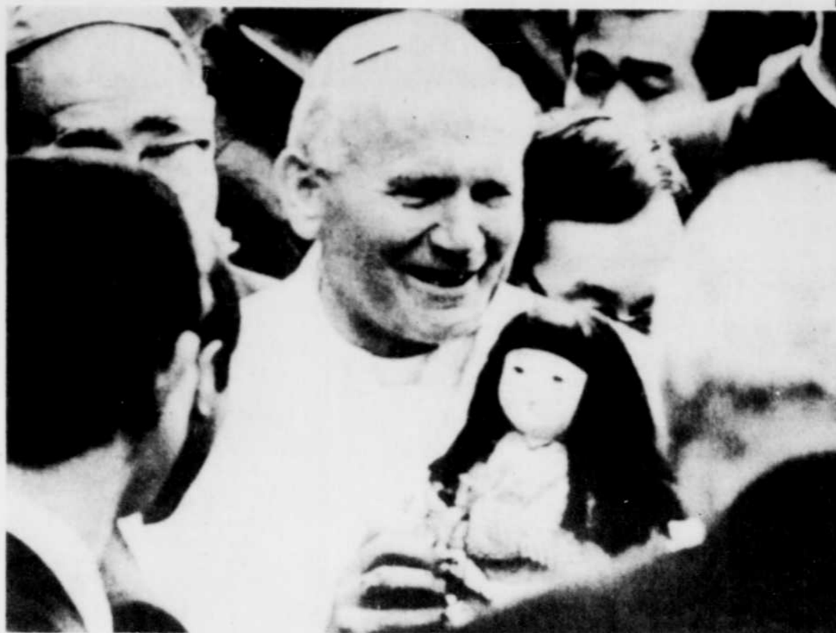
Le pape Jean-Paul II a reçu une poupée japonaise d'un de ses admirateurs alors qu'il se

colonies" dont la création avait été annoncée officiellement depuis plusieurs mois dans le cadre du programme des implantations en Cisjordanie du gouvernement de M. Menahem Begin. Selon ce programme, quelque 30.000 Israéliens devraient habiter dans la colonie de Karnei Shomron, et 50.000 dans celle d'Ariel, toutes deux dans le nord de la Cisjordanie.