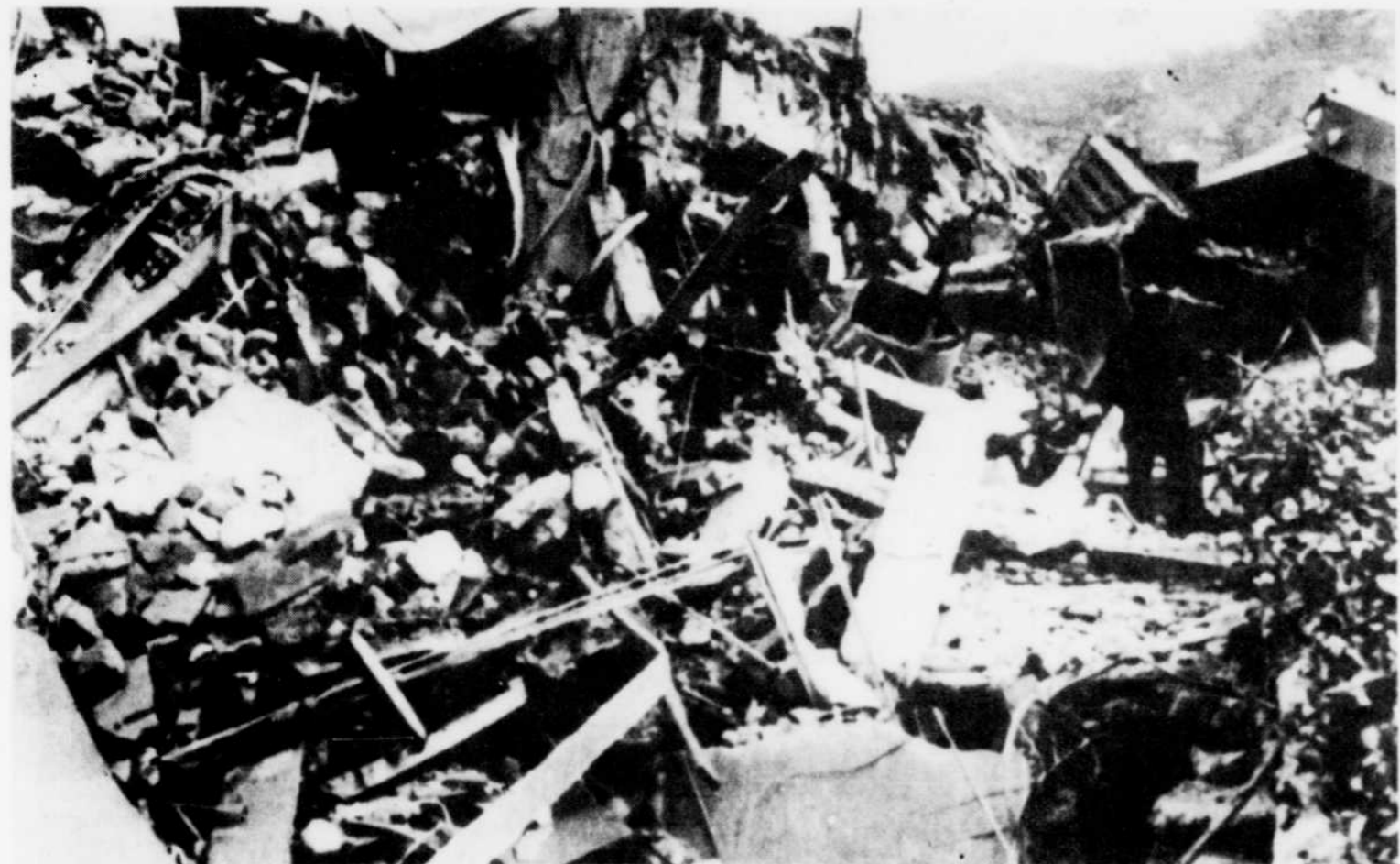
Le violent séisme qui a secoué certaines parties du sud de la Grèce mercredi a causé des dégâts considérables et fait plusieurs morts, comme ici à Loutraki, où un hôtel s'est effondré. La panique s'est emparée des habitants de plusieurs villes et villages.

Le pape polonais ne pouvait pas venir à Nagasaki sans aller se recueillir dans la cellule d'un illustre compatriote, le père Maximilien Kolbe, franciscain, rentré dans son pays juste avant la seconde guerre mondiale, qui, au camp d'Auschwitz, offrit sa vie à la place de celle d'un de ses frères déportés comme lui. Paul VI l'a béatifié. C'est avec les survivants handicapés de l'explosion atomique de 1945 au foyer de la miséricorde de Megumino-Oka que Jean-Paul II termine le dernier jour de son pèlerinage de paix au Japon. Il s'adressera à eux et prendra connaissance d'une série de rapports médicaux sur les cas les plus graves de radiation atomique.