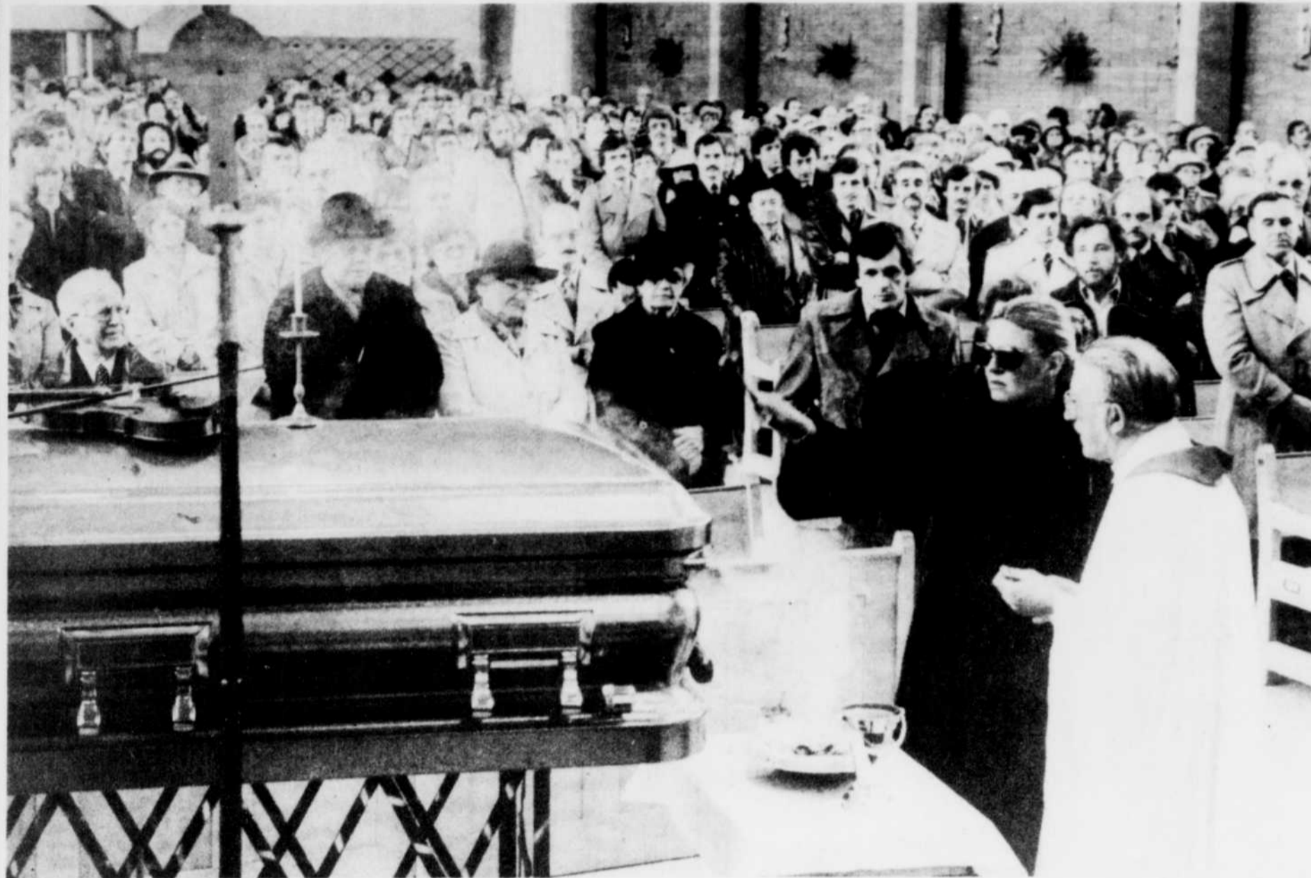
Plus d'un millier de personnes ont envahi l'église Ste-Famille, ses terrains, les rues et le quartier où le célèbre violonneux a résidé durant une bonne partie de sa vie.