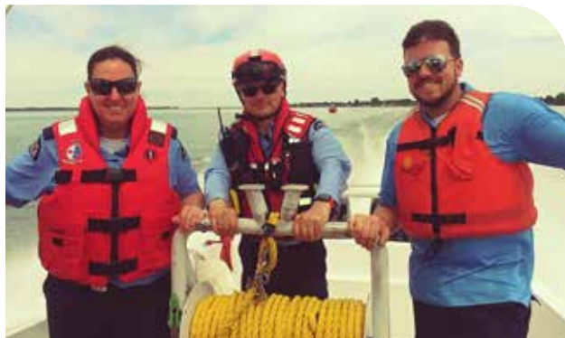
Technique de remorquage (pratique).