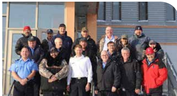
Les membres participant à la réunion de la zone 06 - Nunavik.

Directeur des opérations – Garde côtière auxiliaire canadienne