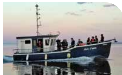
Les invités à bord du BSA Mer l'eau.