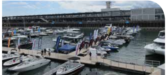
Voici les embarcations dans le Vieux-Port de Montréal.