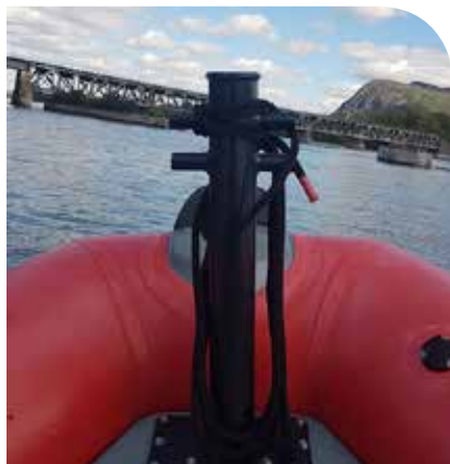
Vue de l'avant de l'Auxiliaire 1234 avec le mont St-Hilaire en arrière plan. Patrouille régulière.