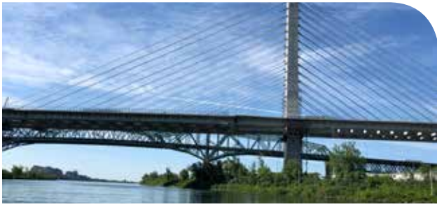
Nouveau Pont Champlain.

Ce fût une belle expérience à voir le déroulement de l'activité sur nos téléphones et pouvoir échanger avec la police et les citoyens sur l'eau. L'unité 56 était sur place pour assurer le passage sécuritaire des navires commerciaux et ceci comme ressource en cas d'incidents maritimes autour du pont. Le son de notre klaxon s'est joint aux nombreux klaxons sur place lorsque le ruban se coupait pour signaler l'ouverture du pont Champlain.