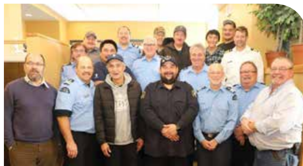
Les membres à l'intérieur lors de la réunion.