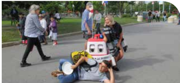
Même les grands s’amusent avec Bobbie...