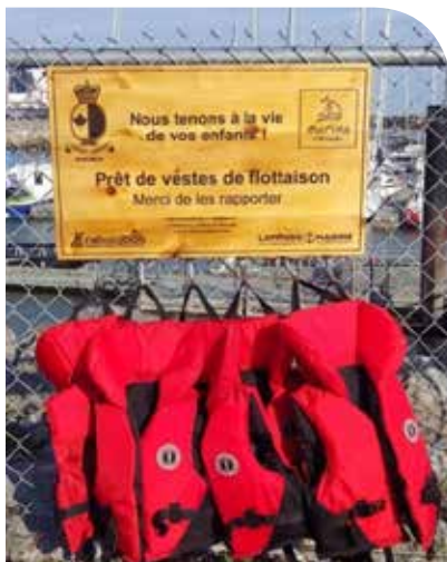
Les enfants ne flottent pas... sans leur VFI.

Dès le début de la saison de navigation 2019, on a constaté un nombre grandissant de noyades au Québec. Les bénévoles de la Garde côtière auxiliaire canadienne (Québec) dont la mission est d'assurer un service de recherche et sauvetage entièrement administré par des bénévoles s'inquiètent également de la montée des noyades et souhaitent agir de façon positive pour trouver une solution.