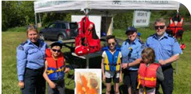
Kiosque de L'Assomption; Pêche en Herbe juin 2019