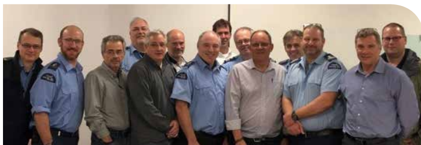
Les membres de l'unité 48 - Haut du Port.

Responsable des communications - Unité 48 - Haut du Port