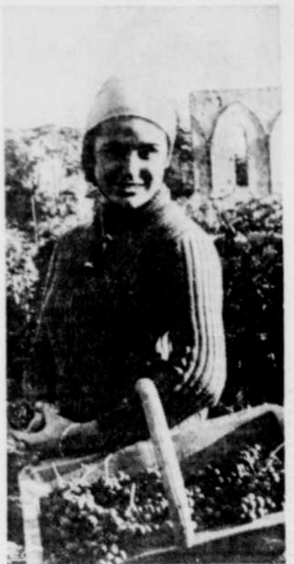
Cueilleuse de raisins.

«La Cave Lungarotti a eu l'heureuse idée de s'adresser à un marché de connaisseurs et d'étendre la gamme de ses vins, poursuit Teresa. L'autonomie d'environ 200 hectares de vignobles permet de maintenir les caractéristiques d'une entreprise familiale où on trouve la tradition de la vinification à côté des technolo-