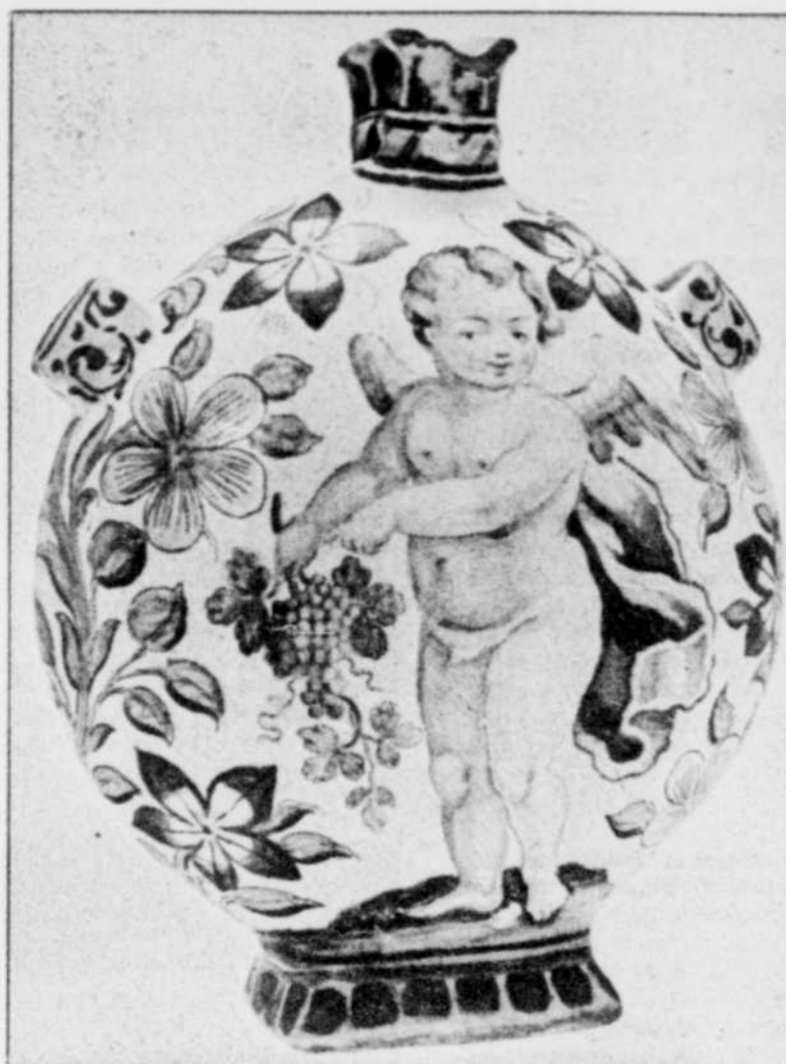
Une pièce du Musée du Vin de Torgiano. C.