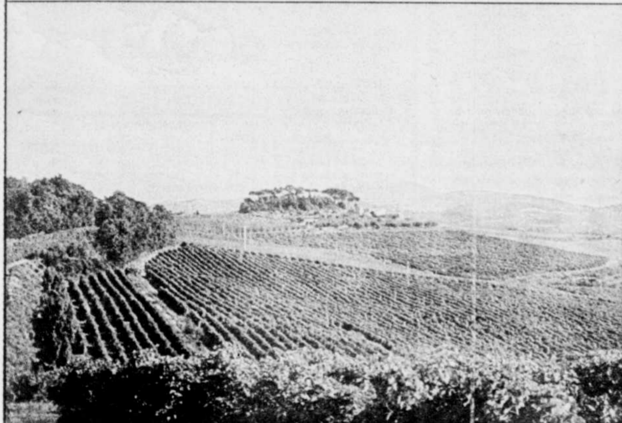
Les vignobles de Torgiano. C.