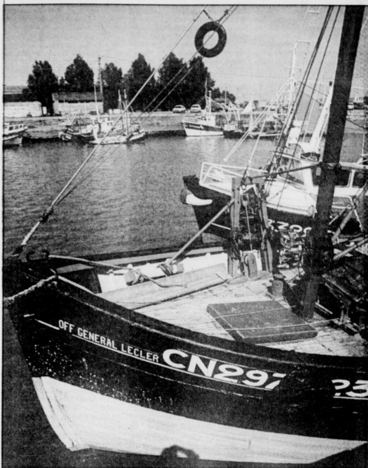
Honfleur en Normandie. C.