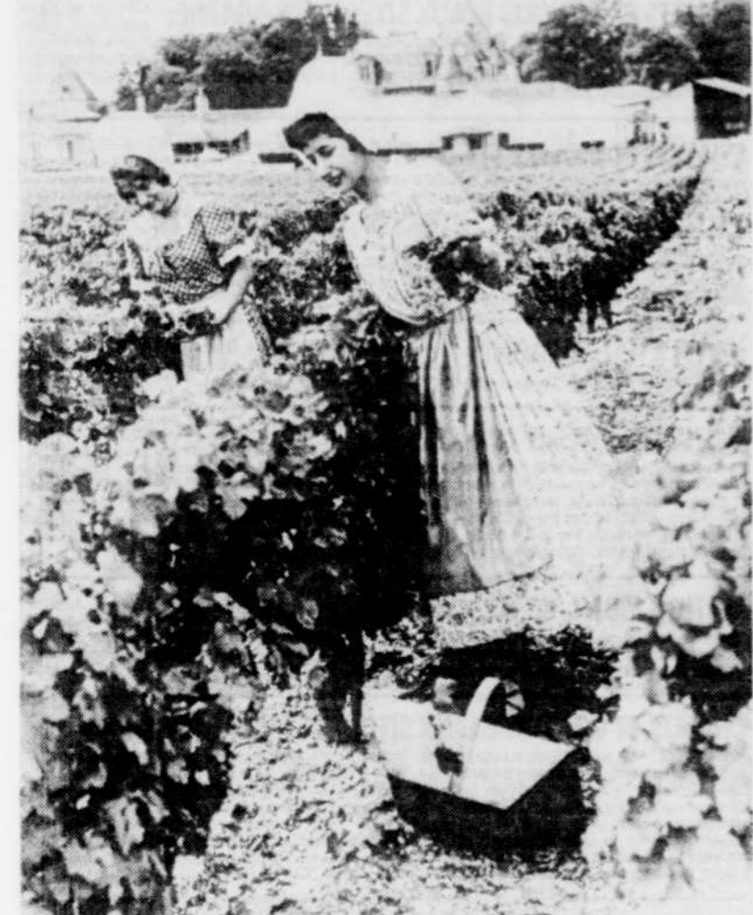
Les charmes des vignobles.

Au bout d'une allée de cyprès centenaires qui offre le plus beau coup d'oeil sur la campagne environnante, se trouvent quelques centaines de caveaux familiaux surélevés, grands comme des petites maisons, construits de pierres de taille et de granit, et savamment plantés de fleurs. A l'intérieur de chaque caveau vitré, des chandeliers multiples restent allumées toute la nuit et toutes les nuits. C'est avec ce respect que les habitants de Torgiano se souviennent de leurs morts. ♦