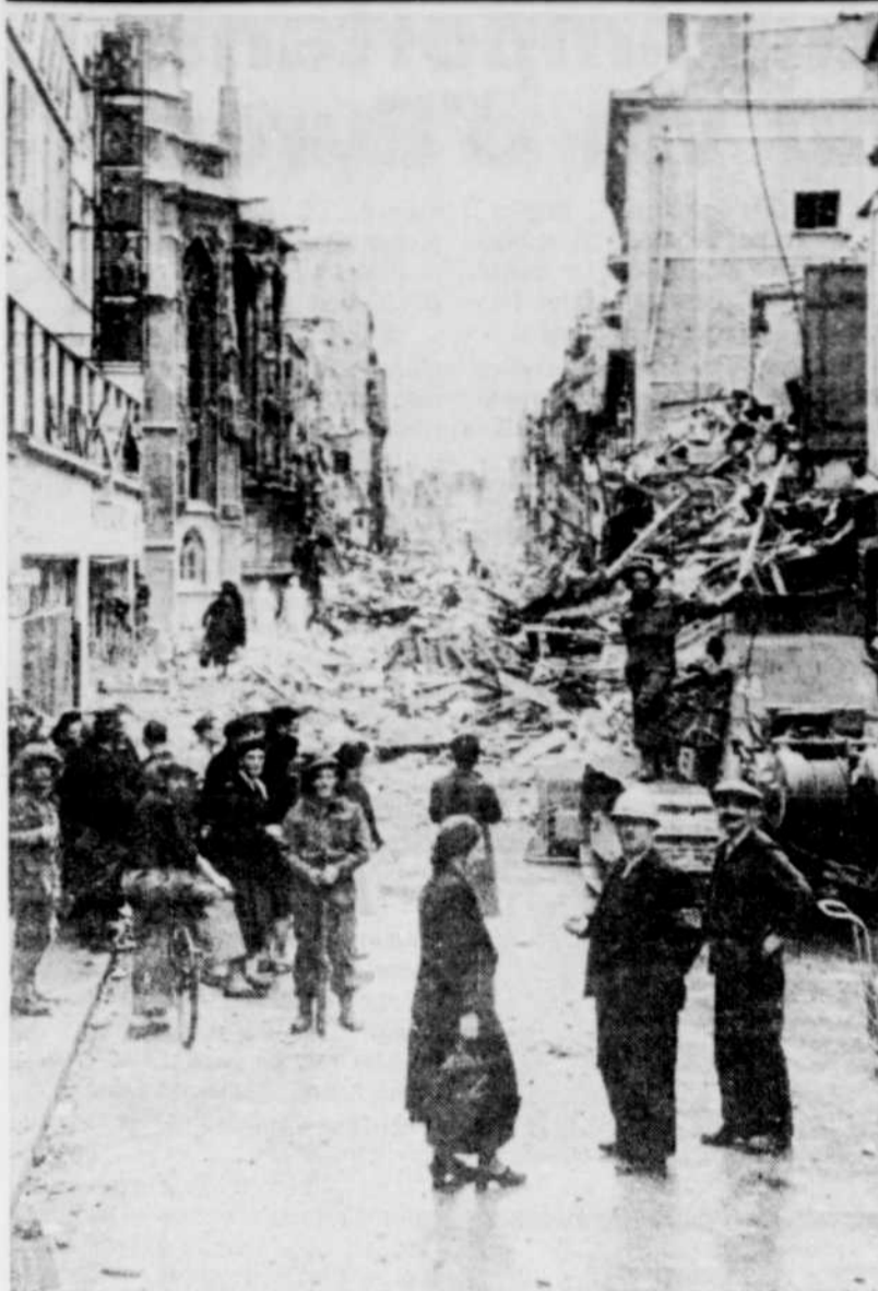
Des soldats canadiens dans les rues détruites de Caen après l'invasion du jour J.