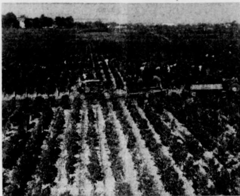
Au temps des vendanges.

Outre une salle dédiée au vin comme médicament, le musée, déjà équipé d'une salle de conférences et de moyens audiovisuels, ouvrira bientôt une bibliothèque oenologique spécialisée très riche en documents sur le sujet.