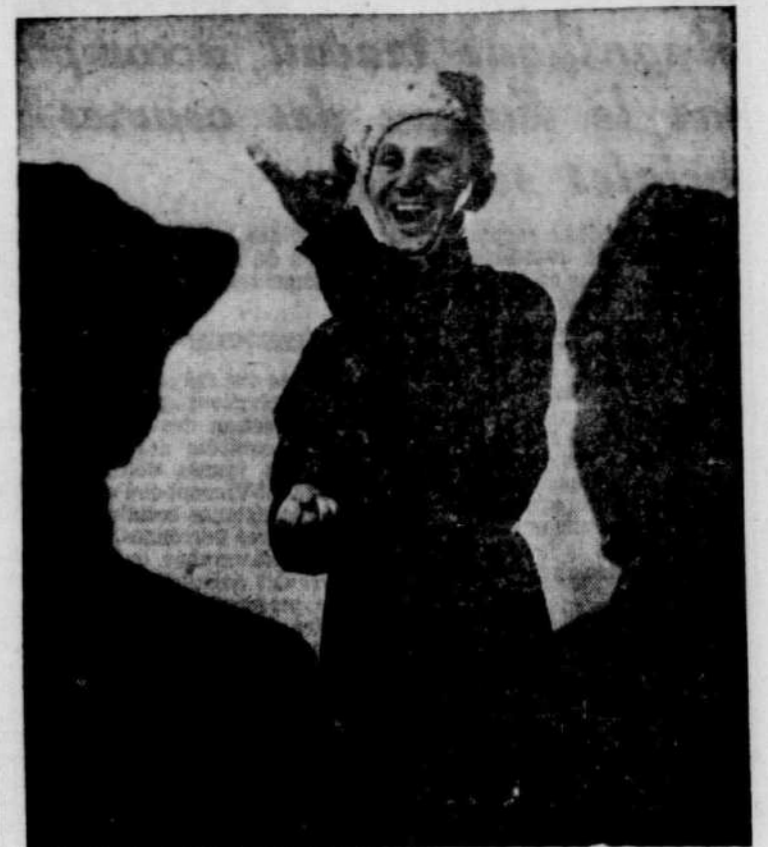
Serge Jaroff, le dynamique directeur du célèbre chœur russe, les Cosaques du Don, qui se fera entendre pour un seul soir à Montréal, samedi soir, le 26 novembre, à l'auditorium du Plateau.