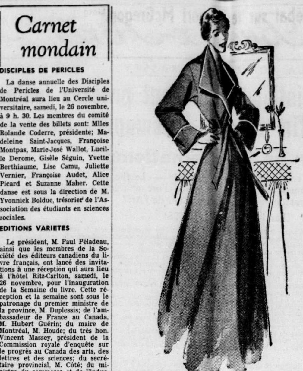
LE CONFORT A LA MAISON — La robe d'intérieur, symbole de l'équilibre chez soi, doit être de bonne coupe et attrayante. Celle-ci, de tanielle bleu-marine est relevée d'un liseré blanc autour du large col et marquant le revers de la manche.