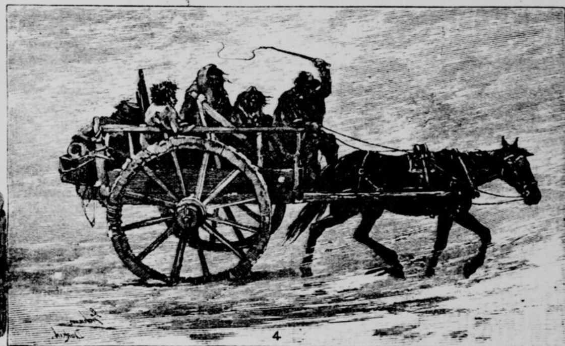
1. Lac et rivière qu'Appelle.—2. Fort qu'Appelle et vallée.—3. Eclaireurs blancs et métis.—4. Voiture de Métis.—5. En route pour rejoindre Riel.—6. Artilleurs Métis.

L'INSURRECTION DU NORD-OUEST.—SCÈNES SUR LA SASKATCHEWAN.