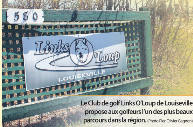
Le Club de golf Links O'Loup de Louiseville propose aux golfeurs l'un des plus beaux parcours dans la région.