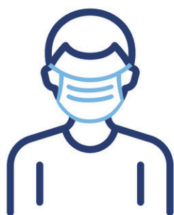
Couvre-visage en papier ou en tissu