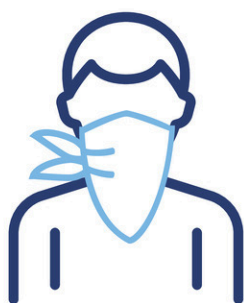
Bandana ou autre tissu