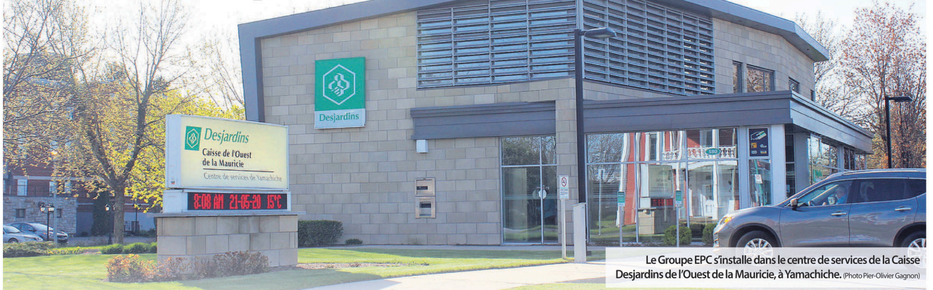
Le Groupe EPC s'installe dans le centre de services de la Caisse Desjardins de l'Ouest de la Mauricie, à Yamachiche.

PIER-OLIVIER GAGNON pogagnon@lechodemaskinonge.com