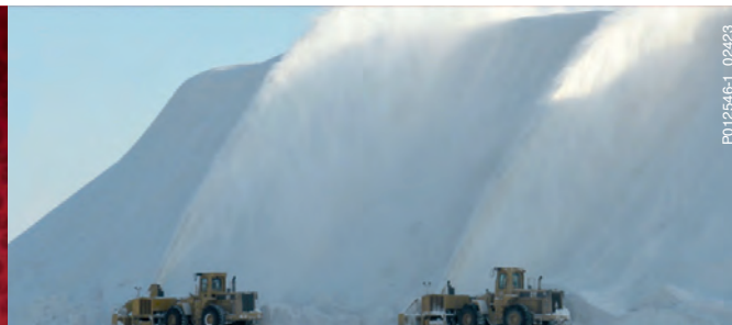
SERVICE DE DÉNEIGEMENT