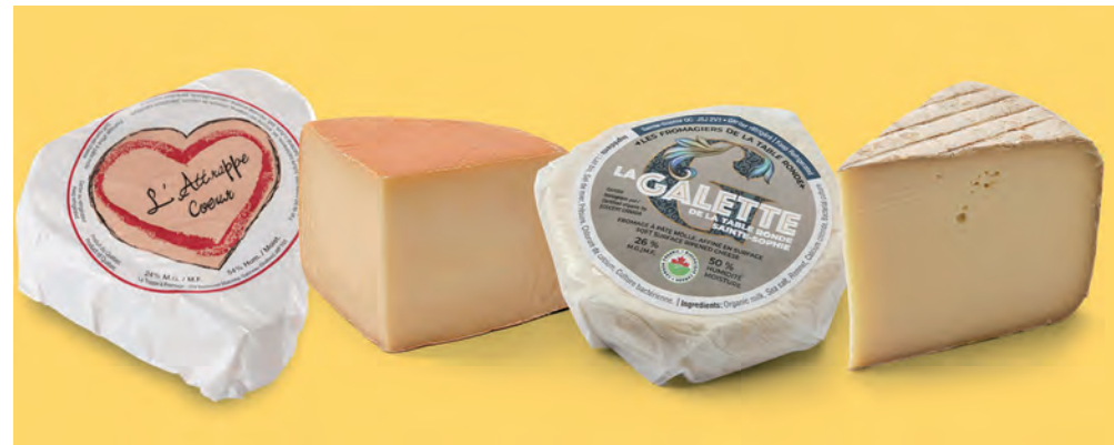
De gauche à droite : L'Attrappe Cœur de la fromagerie La Trappe à Fromage, Le Fou du Roy, La Galette de la Table Ronde et Le Ménéstrel de la fromagerie Les Fromagiers de la Table Ronde.