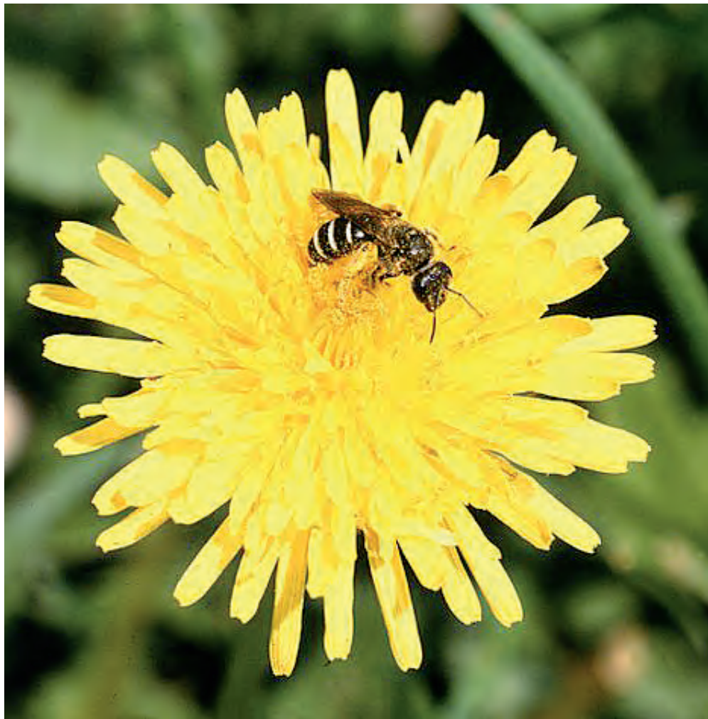
Bas de vignette : une importante mortalité des colonies d'abeilles a été observée dans la région des Laurentides et de Laval.