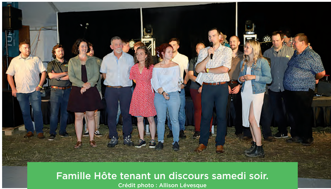
Famille Hôte tenant un discours samedi soir.

Les 12 et 13 août derniers se tenait la Fête champêtre de Mirabel et Deux-Montagnes sur la Ferme Laitière Ambijoie. Celle-ci se veut un événement rassembleur autant pour les familles du milieu urbain que du milieu agricole. Il y avait, au programme, un souper-spectacle, des visites de la ferme hôte, des compétitions agricoles, des tours d'hélicoptères, des acrobaties sur chevaux, un concours de génisses et plus encore. La Société d'agriculture Mirabel Deux-Montagnes a comme mission de promouvoir l'agriculture et cette 45 e édition de la Fête a permis de réaliser cet objectif avec plus de 80 partenaires de la région. Merci à tous ces partenaires et visiteurs ainsi qu'à la Famille Gratton, qui ont fait de cette 45 e édition un succès.