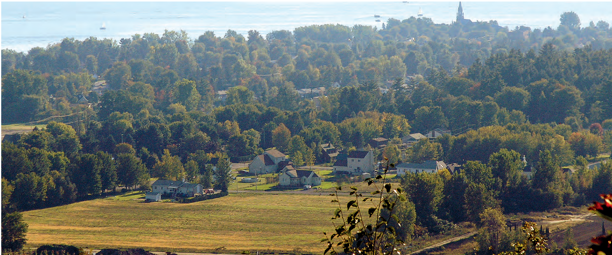
La municipalité d'Oka.