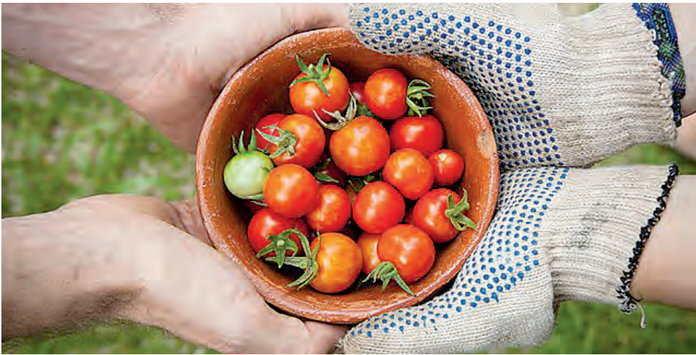
La tomate est le principal fruit cultivé en serre au Québec.