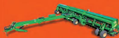
Semoir Min-Till repliable