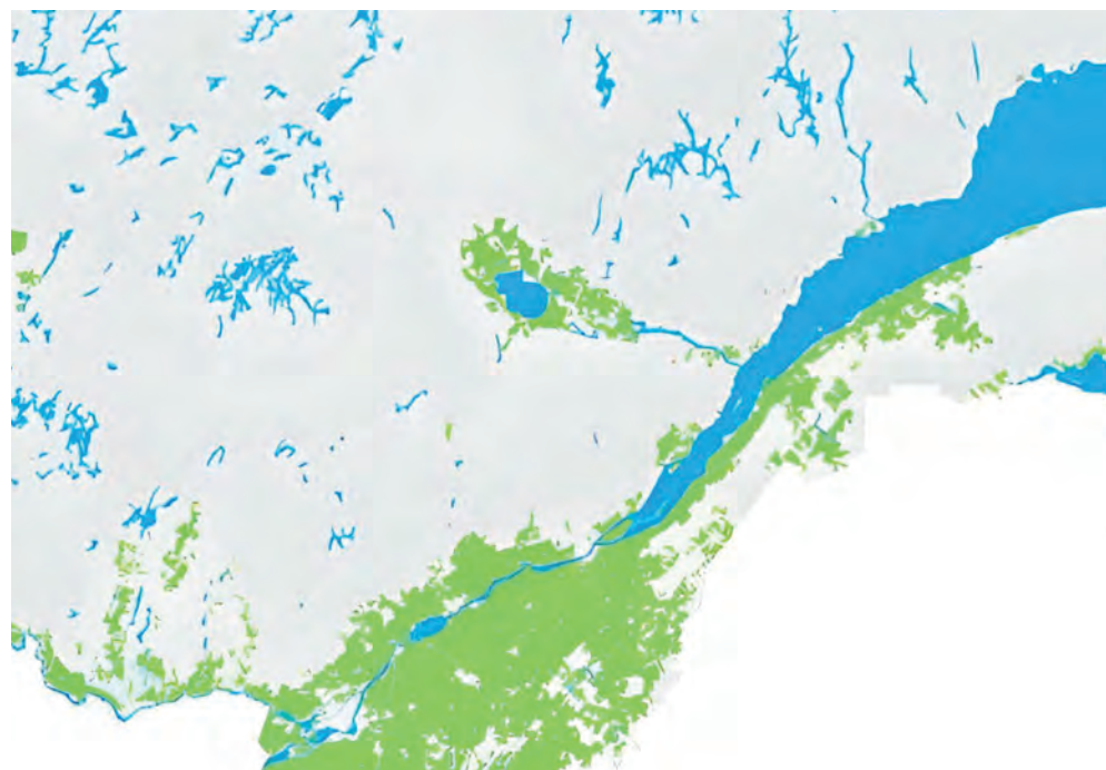
En vert, les terres protégées par la Loi sur la protection du territoire agricole.

À la suite de la publication de chacun des fascicules, la population est invitée à se prononcer en envoyant