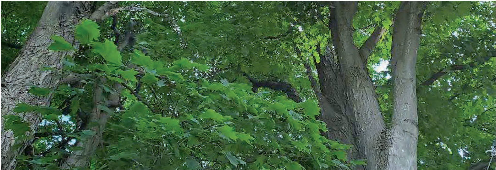
Les Laurentides et l'Outaouais représentent l'avenir de l'acériculture au Québec.