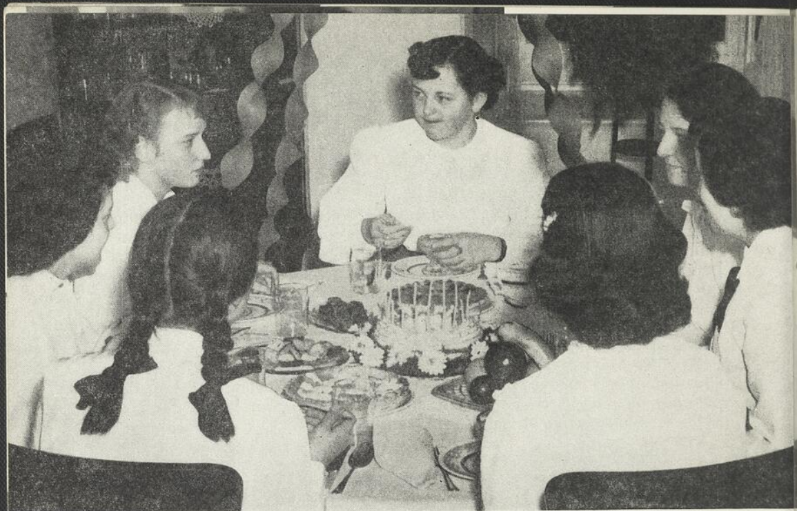
Une "famille" fête sa maman...

...une autre prépare la messe du dimanche