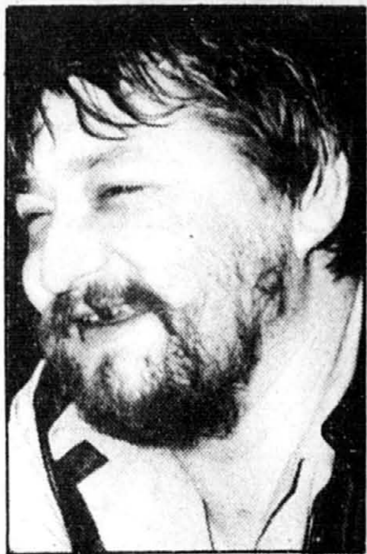
Rainer Werner Fassbinder

La série entraîne le spectateur à travers toute une gamme d'émotions fortes. Franz Biberkopf n'échappera pas à la fascination qu'exercent sur lui les femmes et ce qu'on pourrait appeler la marginalité. Les premières, il les veut soumises, de préférence masochistes. Il est capable pour elles des plus