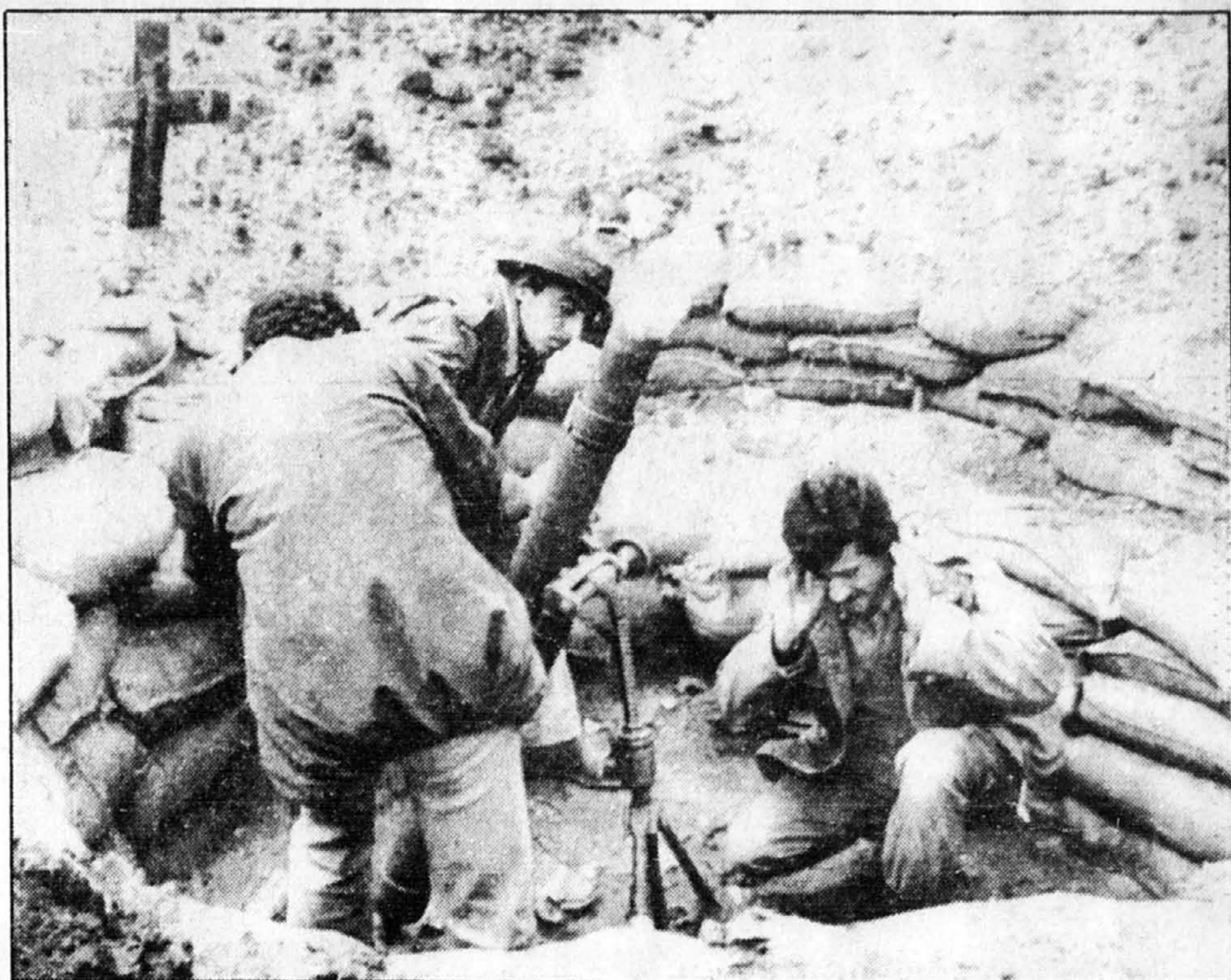
Les affrontements continuent de faire rage à Beyrouth.

La jeune femme a défilé longuement entre deux rangées de barbelés, devant des plaques de blindage et des chevaux de frise, tandis qu'à l'intérieur de l'hôtel les protagonistes de la guerre du Liban poursuivaient leurs tractations.