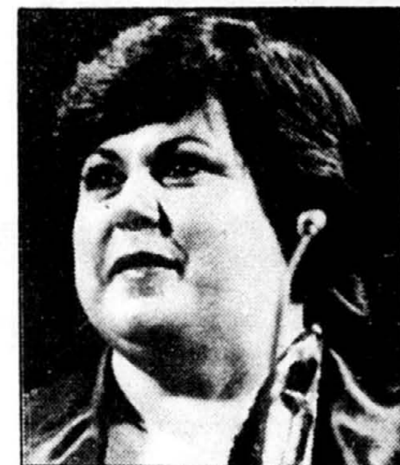
Un seul spectacle

Mais il a suffi d'une apparition samedi soir au show de l'animateur de télé Michel Drucker pour qu'elle devienne une nouvelle valeur. Michel Drucker est monté sur la scène de l'Olympia pour présenter Ginette Reno, qui a chanté en français et en anglais. Les Français, conquis, ont applaudi sans se faire prier.