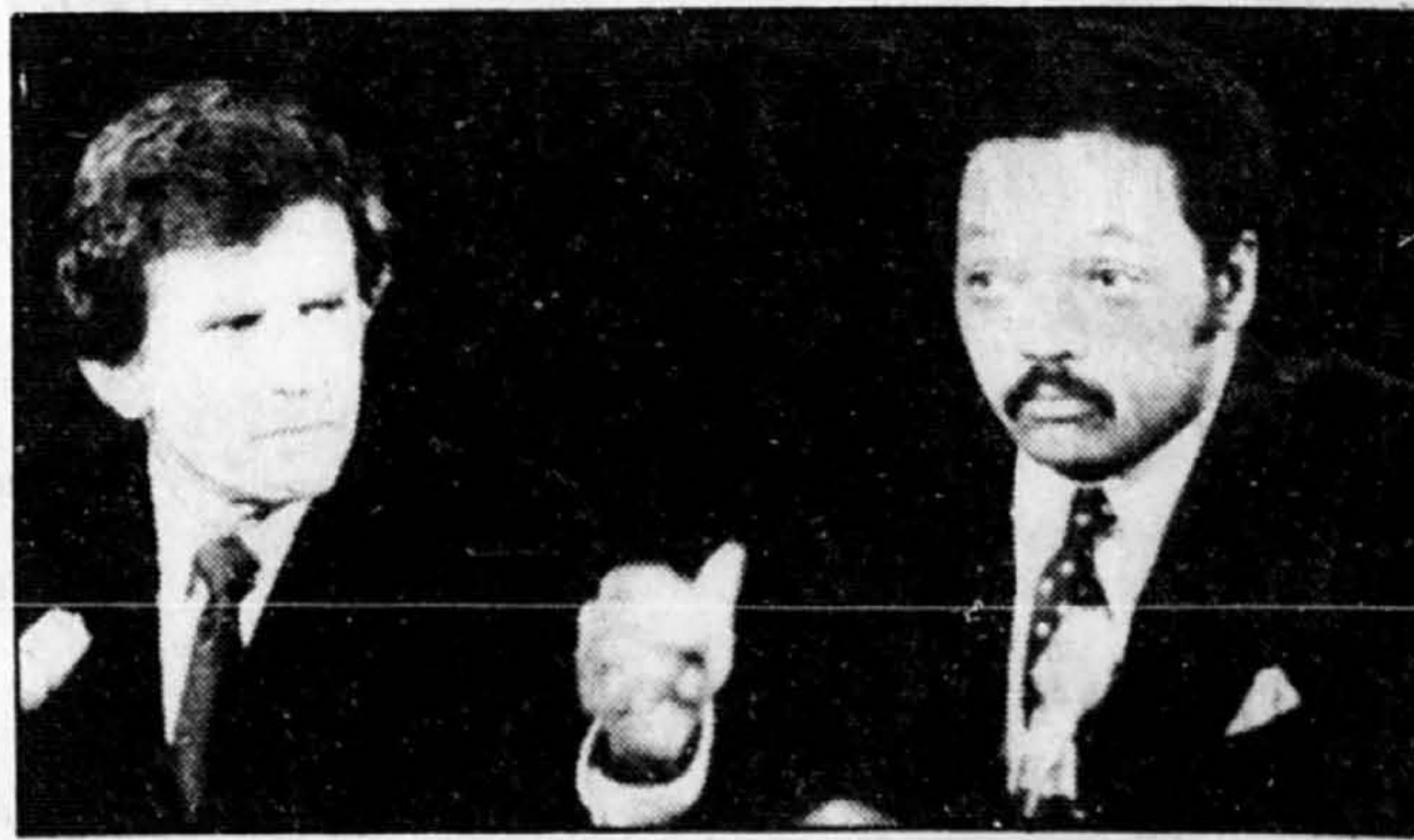
Gary Hart et Jesse Jackson lors du débat de Chicago.

Le problème des droits civiques a été au centre d'un débat télévisé organisé dimanche à Chicago, M. Mondale affirmant qu'il y avait une différence dramatique entre son engagement en faveur des noirs et celui de M. Hart. Le sénateur du Colorado, lui, a proclamé que le soutien ap-