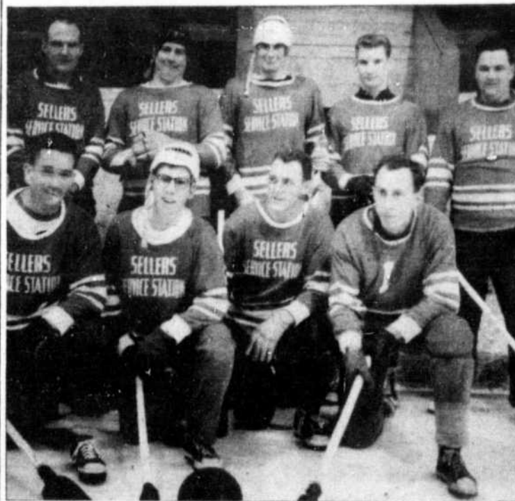
L'équipe Sellers Esso de Buckingham, finaliste de la ligue de ballon sur glace de la ligue Centrale.