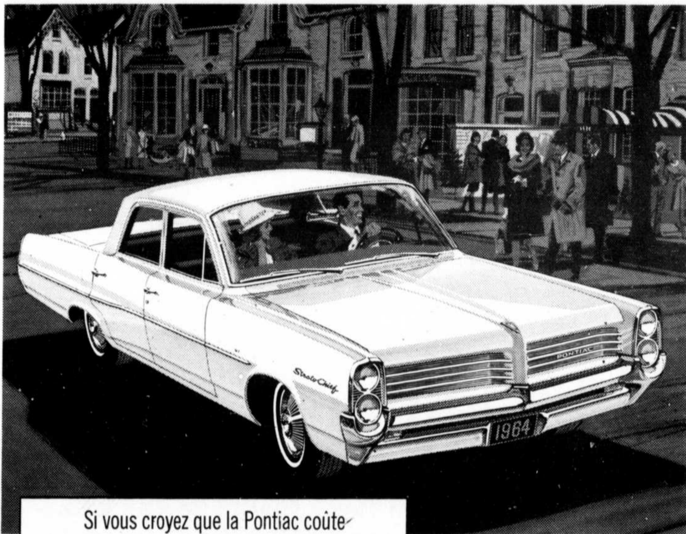
UNE VALEUR GENERAL MOTORS Sedan Strato-Chief, 4 portes

Si vous croyez que la Pontiac coûte beaucoup plus cher que les voitures ordinaires