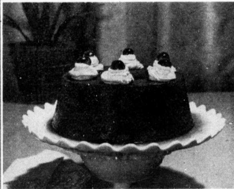
BABA À L'ÉRABLE.