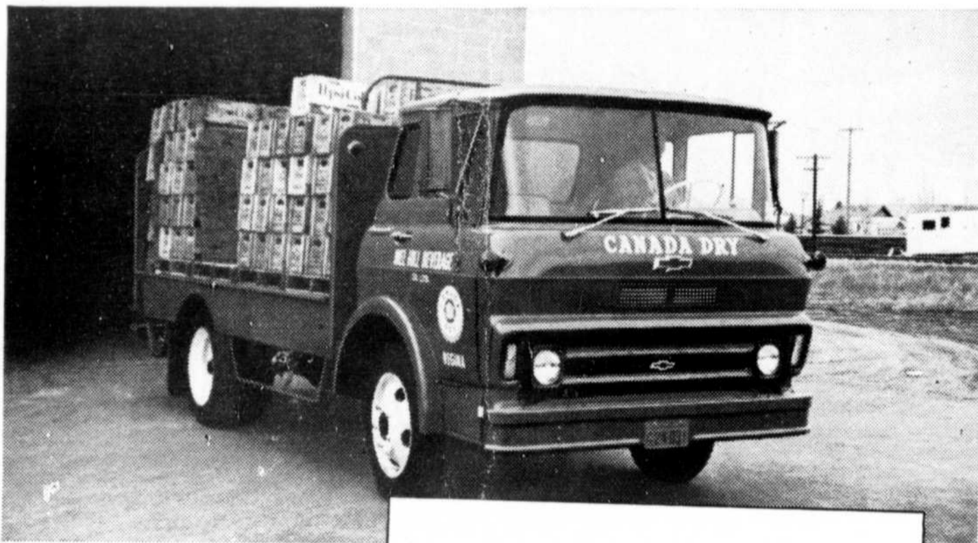
UNE VALEUR GENERAL MOTORS

Le Bulletin de Buckingham Buckingham, Qué.