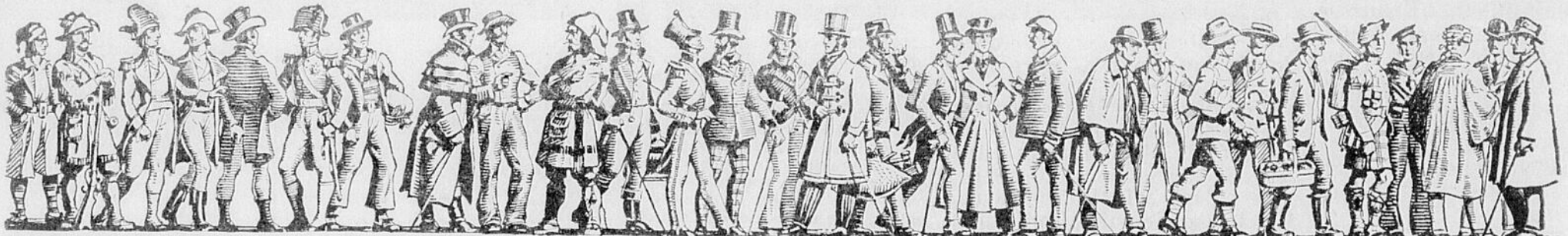
CENT CINQUANTE ANS DANS LA RUE NOTRE-DAME

La population de Québec pourra juger avec encore plus de sérénité et elle rendra hommage au courage ainsi qu'au bon jugement de l'honorable Premier Ministre, comme elle l'a fait tant de fois dans le passé.