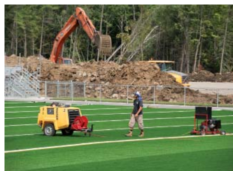
Le nouveau terrain de soccer-football à surface synthétique au bout de la rue Filion.

D'une superficie approchant les deux millions de pieds carrés, le terrain se présentait comme une carrière où la machinerie lourde effectuait l'extraction du roc, le concassage en gravier et le transport vers le dépôt de matières sèches de la ville, situé tout près. Des concasseurs mobiles et des trieuses conditionnaient chaque jour des tonnes de gravier, un approvisionnement dont la voirie municipale tirera parti pendant de nombreuses années.