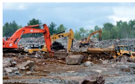
À la fin du mois de juin, il était assez surréaliste d'apercevoir le terrain de soccer-football émerger des entassements de roc plus hauts que des maisons, tout autour.