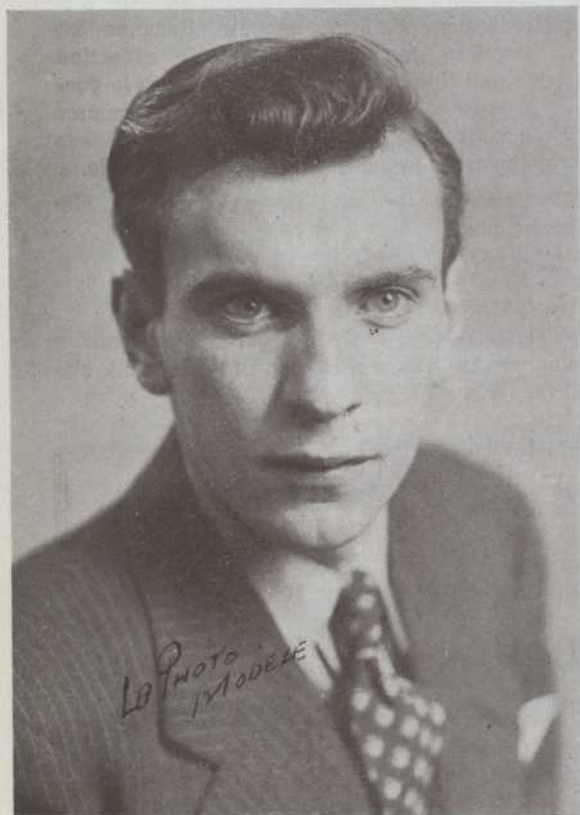
M. Jean Duceppe