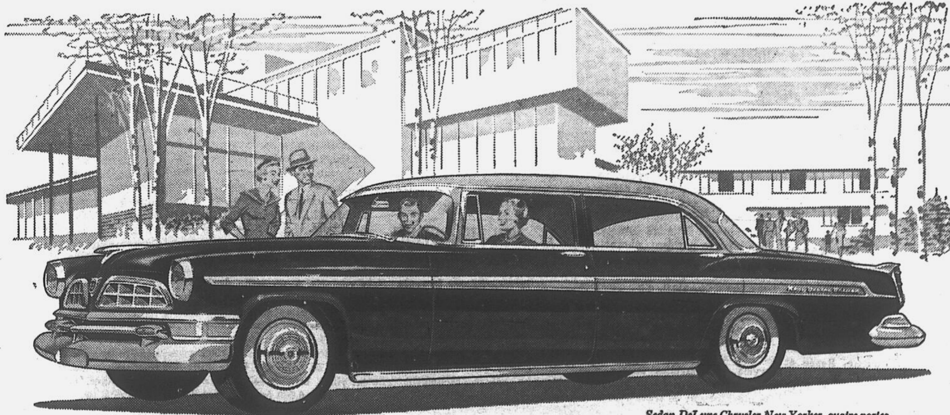
Sedan DeLuxe Chrysler New Yorker, quatre portes

Dans chaque détail de sa silhouette, cette superbe voiture est d'une élégance incroyable, reflétant un goût parfait.