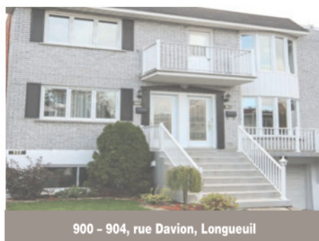
900 - 904, rue Davion, Longueuil

Située dans un secteur paisible et familial, voici une magnifique maison intergénérationnelle au 2 e étage avec son entrée indépendante. Propriété clés en main entièrement rénovée. Jolie cuisine avec îlot central et comptoir de quartz. Deux chambres au rdc, salon et salle familiale au sous-sol. Aucun voisin à l'arrière. Bonne visite! 799 900 $. Centris 15472777