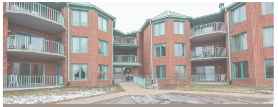
100, boul. Taschereau, app.302, La Prairie

Magnifique! Rénovée en 2018, vous resterez bouche bée dès votre entrée! Cette maison à aire ouverte moderne est pourvue d'un plancher de bois et d'un plafond cathédrale. Luminosité exceptionnelle au rez-de-chaussée comme au rez-de-jardin. Total de quatre cac. Terrain de plus de 12 400 pi 2 situé dans un secteur recherché. Une visite et vous serez conquis. 449 000 $. Centris 20889717