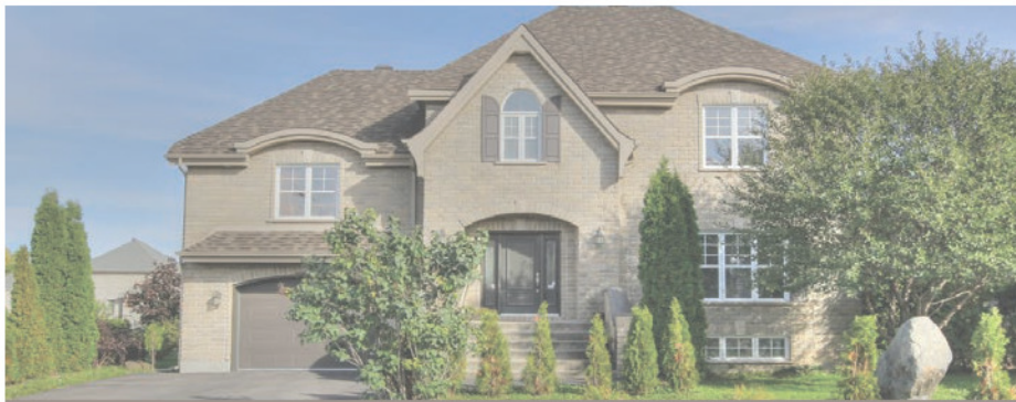
3200, boul. De Boucherville, Saint-Bruno-de-Montarville

Somptueuse propriété avec garage, sise dans un quartier à envier! Distinction et confort sont au rendez-vous dans cette magnifique maison de cinq chambres à coucher et trois salles de bain! Présence accrue de lumière naturelle dans toutes les pièces, matériaux de qualité, et plus encore! Grand terrain (coin de rue) paysager. À voir absolument! 599 000 $. Centris 27200457