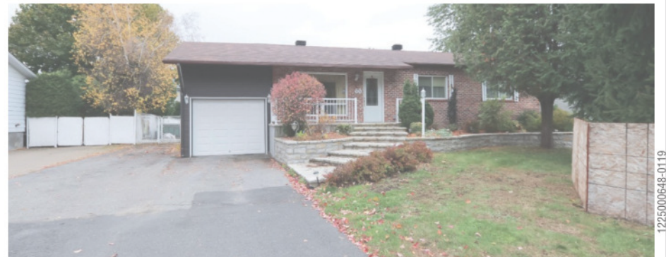
60, Grand Boulevard O., Saint-Bruno-de-Montarville

Somptueuse propriété avec garage, sise dans un quartier à envier! Distinction et confort sont au rendez-vous dans cette magnifique maison de cinq chambres à coucher et trois salles de bain! Présence accrue de lumière naturelle dans toutes les pièces, matériaux de qualité, et plus encore! Grand terrain (coin de rue) paysager. À voir absolument! 599 000 $. Centris 27200457