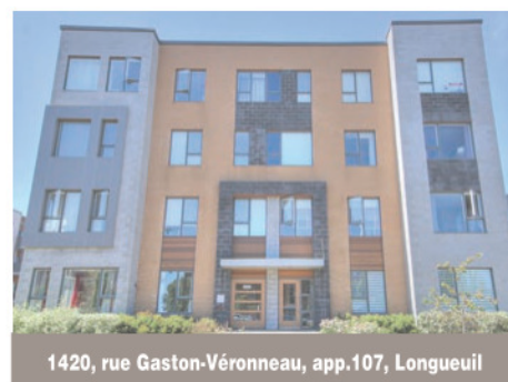
1420, rue Gaston-Véronneau, app.107, Longueuil

Beau duplex avec un logement rénové de trois pièces au sous-sol. Proche des écoles et parc, les deux logements principaux ont trois chambres, plancher de lattes au rez-de-chaussée et à l'étage, grand garage pour logement du rez-de-chaussée et belle salle familiale. Duplex entretenu au fil des années. Grande chambre froide en dessous de la galerie. 519 000 $. Centris 26357168