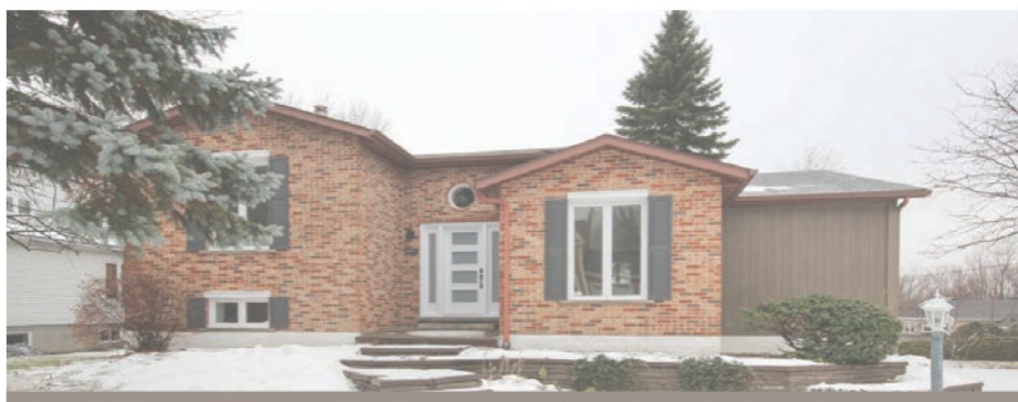
604, rue Wolfe, Mont-Saint-Hilaire

Magnifique! Rénovée en 2018, vous resterez bouche bée dès votre entrée! Cette maison à aire ouverte moderne est pourvue d'un plancher de bois et d'un plafond cathédrale. Luminosité exceptionnelle au rez-de-chaussée comme au rez-de-jardin. Total de quatre cac. Terrain de plus de 12 400 pi 2 situé dans un secteur recherché. Une visite et vous serez conquis. 449 000 $. Centris 20889717