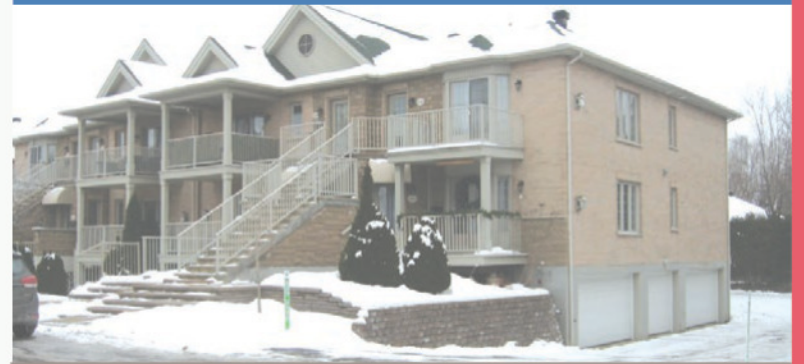
1588, rue Saint-Jacques, Saint-Bruno-de-Montarville

Unité de coin, condo très lumineux, cuisine, salle de bain rénovée au goût du jour, foyer au gaz dans le salon. En plein coeur du village, tout peut se faire à pied, ensoleillé. 284 500 $. Centris 12615627