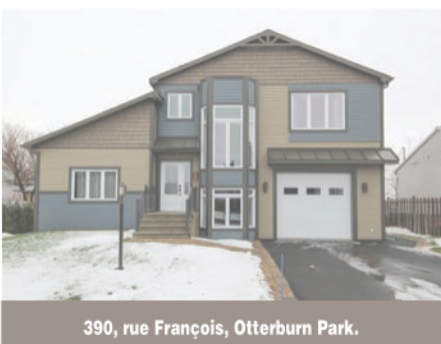
390, rue François, Otterburn Park.

Coup de coeur! Venez visiter cette unité de coin à l'étage supérieur (3e). Condo lumineux et ensoleillé grâce à sa grande fenestration. Belle cuisine fonctionnelle, salle à manger donnant sur le balcon, salon avec magnifique foyer deux faces, plafond de près de 10 pieds. Ascenseur, piscine, sauna et gym, garage double intérieur avec grand rangement. 289 000 $. Centris 24726402