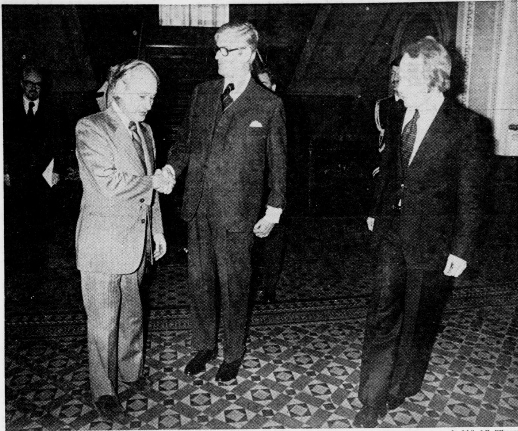
Le Soleil, J.-M. Villeneuve

Constatant que les pharmaciens n'avaient pas été suffisamment présents jusqu'à maintenant dans les grands débats sur la santé, M. Marois s'est demandé si ce rôle effacé ne tiendrait pas au fait que le Québec manque de pharmaciens.