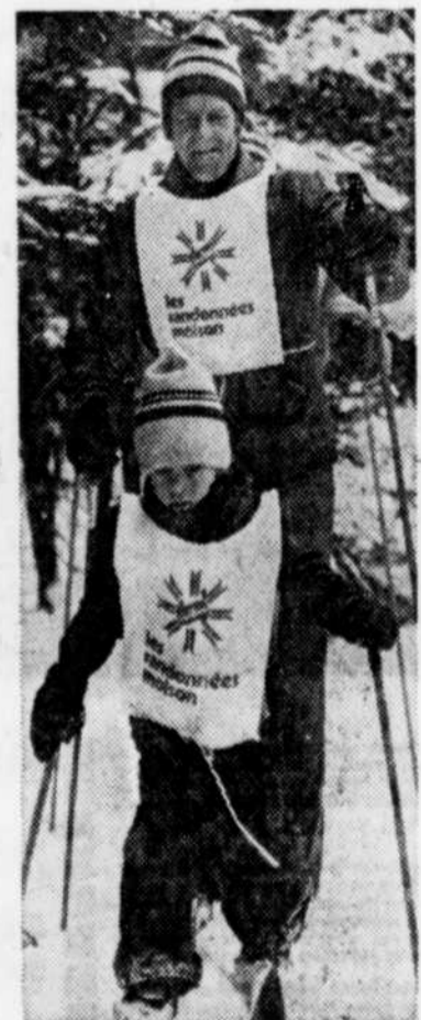
Jeunes et moins jeunes, bien étiquetés du dossard des commanditaires, participent aux "grandes randonnées Molson-CKCV". Ce n'est pas la performance qui compte mais la découverte des petits plaisirs de l'hiver. Et si l'on peut danser et prendre une petite bière, après ça, alors...

Quand les "grandes randonnées" s'installent dans un club, comme ce fut le cas dimanche au Sapin d'or, la piste choisie est balisée de fanions "Laurentide". La joyeuse balade couvre cinq kilomètres seulement, mais on n'empêche personne d'aller au-delà de cet objectif si désiré.