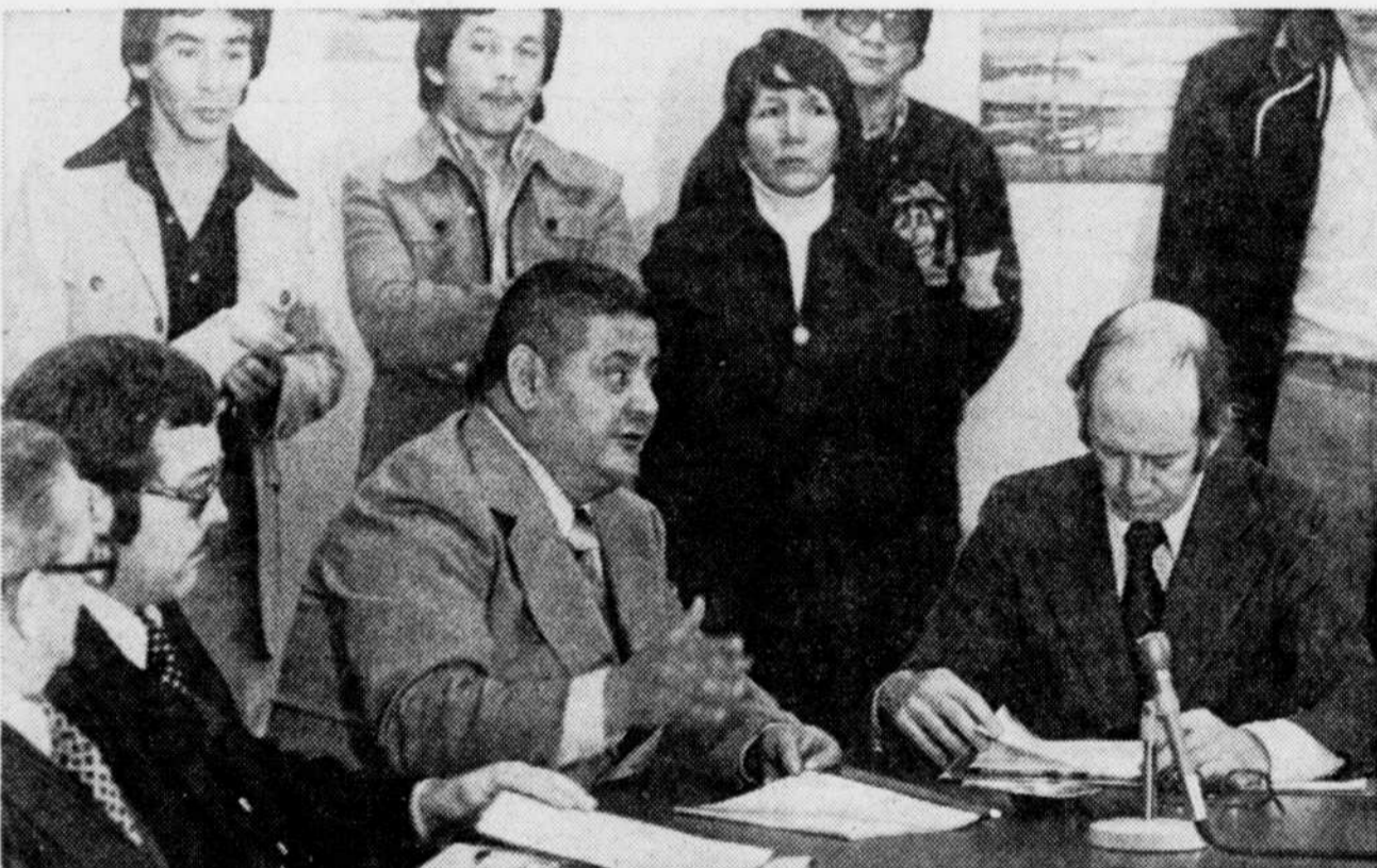
La visite à Sept-Iles du ministre des Affaires indiennes, M. Warren Allmand, aura été de courte durée...

"De plus, j'ai aujourd'hui reçu l'assurance de la société Boeing que pas un seul sou n'a été remis en aucun temps à aucun employé d'Air Canada.