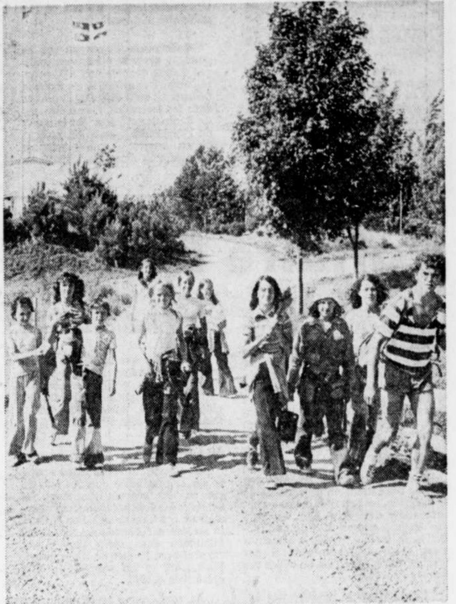
La vie de camp, souvent, c'est apprendre à connaître ses ressources autant physiques que morales, sa résistance à la chaleur, la fatigue, à la soif. Toutes choses sur lesquelles une bonne excursion pédestre peut vous renseigner!

Voici un tableau montrant 21 camps installés dans la grande région de Québec. Ils sont tous membres de l'Association des camps du Québec.