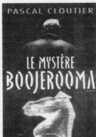
Pascal CLOUTIER, Le Mystère Boojerooma, Éd. JCL, 2003, 211 pages, 19,95 $

procure ce suspense. L'organisation romanesque s'articule autour de trois mouvements présentés en alternance dans les vingt-trois courts chapitres proposés. Le premier mouvement fait le récit d'événements étranges et dramatiques qui se produisent ici et là, sans qu'on puisse les expliquer; le second raconte les relations qu'entretient un groupe d'amis de Montréal, qui se sont associés bona fide en se donnant pompeusement le nom de «compagnie» et qui investissent quelques économies à la bourse; le troisième volet de l'action réside dans la description des complots machiavéliques de l'entreprise dont le monopole est menacé. Ainsi construit, le roman propose un crescendo au cours duquel le mystère s'épaissit jusqu'à son