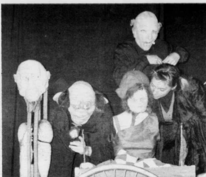
EXCELLENT - La palme revient à «Poupzée», du théâtre CRI.

que du Royaume a permis d'entendre de jeunes musiciens talentueux et extrêmement prometteurs.