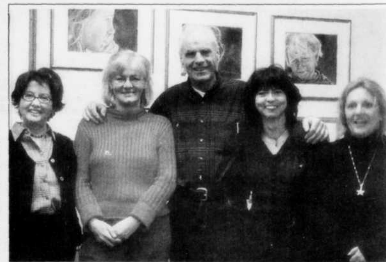
CONCOURS- Le concours Expo-Sélect organisé par le regroupement Les artistes la Maestria est en cours pour la deuxième année. Ci-haut les membres de La Maestria.