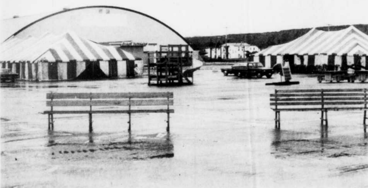
C'est sous une température inclemente que les préposés aux Fêtes de l'Amiante ont terminé l'aménagement des facilités qui accueilleront

Finalement, toute cette programmation tourne autour du célèbre Tournoi international des Caisses pop qui, encore cette année, mettra en compétition dix équipes de balle-rapide provenant de l'Ontario, des Maritimes, des Etats-Unis et du Québec.