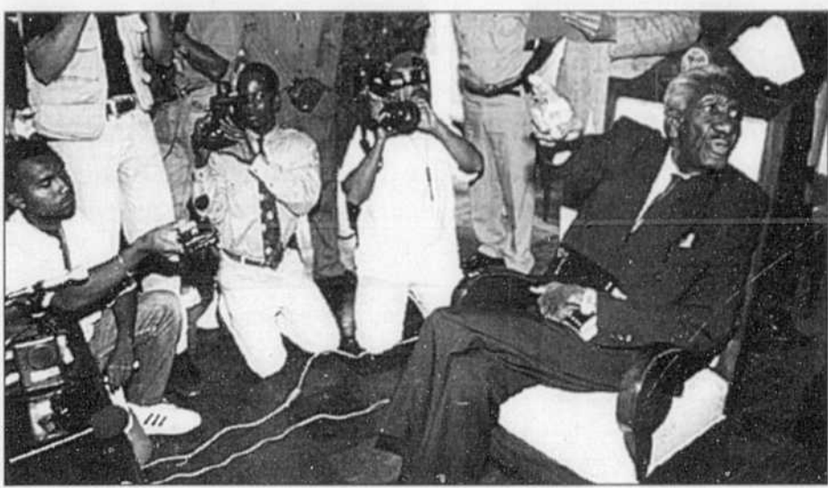
Le «président provisoire» Émile Jonassaint, hier à Port-au-Prince

M. Constant nie que le FRAPH ait recours à la violence. «Ce n'est ni dans nos méthodes, ni dans nos idées», dit cet ancien élève du collège Marie-Victorin, du Cégep du Vieux Montréal et de l'Université Concordia. Il a été également attaché commercial d'Haïti à Ottawa au début des années 80. Aujourd'hui, Emmanuel Constant est persona non grata au Canada, même si sa femme, ses enfants et son frère sont des résidents de Montréal.