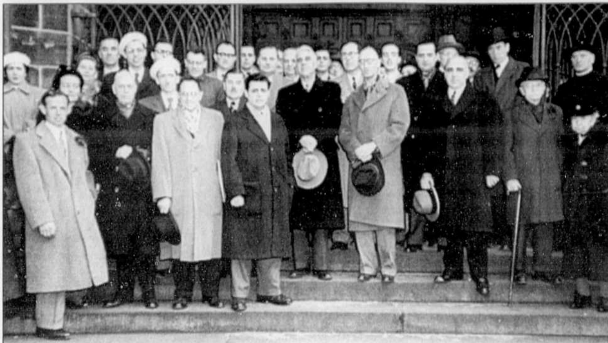
Un groupe d'admirateurs du maréchal Pétain qui venait d'assister à une messe en sa mémoire à l'église Notre-Dame à Montréal, en novembre 1951.