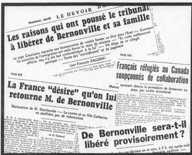
Les journaux de l'époque, dont LE DEVOIR , donnaient des indications précises sur les accusations portées et les condamnations à mort prononcées outre-Atlantique contre les collaborateurs français entrés au Canada.

Pour les nationalistes de la vieille école fortement influencée par la pensée maurrassienne, le nationalisme libéral des années 1960 prend l'allure d'une véritable apostasie.