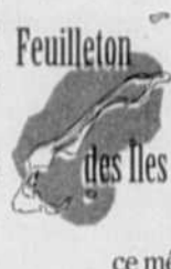
Feuilleton des îles