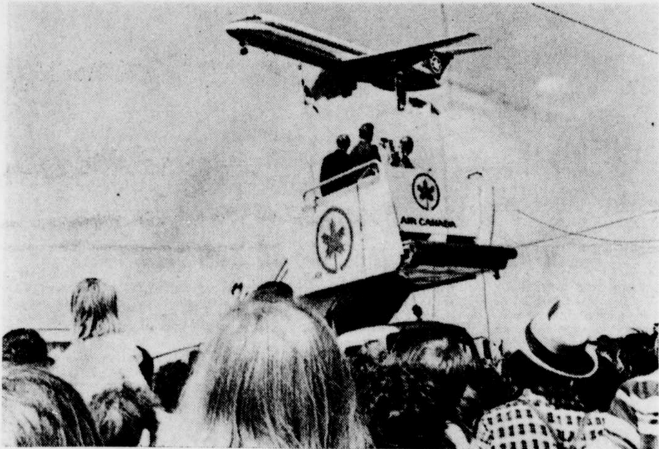
UN DC-9 d'Air Canada vrombit au-dessus des têtes en survolant à basse altitude l'emplacement du futur aéroport international de Ste-Scholastique au moment où le premier ministre, M. Pierre Elliott-Trudeau prononce un

"Il faut au plus tôt déloger le chef du gouvernement, qu'il soit premier ministre ou président, de certaines tâches trop astreignantes. Plusieurs d'entre elles pourraient être assumées avec beaucoup plus d'efficacité par des membres du Cabinet ministériel", suggère-t-il dans son livre.