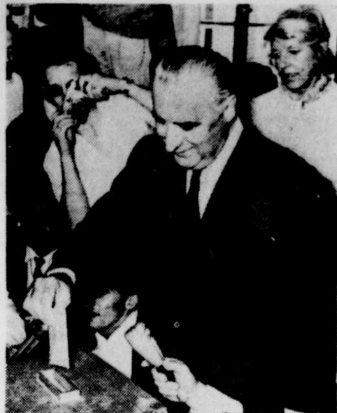
M. GEORGES POMPIDOU, successeur du général de Gaulle, déposant son bulletin de vote.

Bien qu'aucune indication n'ait filtré sur les intentions de M. Georges Pompidou quant au choix de son premier ministre, les observateurs relèvent que le nom de M. Jacques Chaban-Delmas est fréquemment cité dans les milieux politiques. Si cette hypothèse devenait réalité, l'Assemblée nationale serait appelée en priorité, dès le jour de la reprise de la session, le 24 juin, à élire son nouveau président (le nom de M. René Pleven est prononcé). Dans ce cas, la déclaration de politique générale ne serait faite au parlement que le mercredi 25 juin.