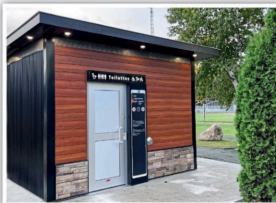
Visuel (à titre indicatif seulement) d'une installation de l'entreprise Urbenblue.

SAINTE-SOPHIE-DE-LÉVRARD. La municipalité de Sainte-Sophie-de-Lévrard travaille fort pour se doter d'une toilette intelligente, qu'elle souhaite mettre à la disposition des utilisateurs de la piste d'hébertisme et des sentiers boisés situés à l'arrière de l'église.