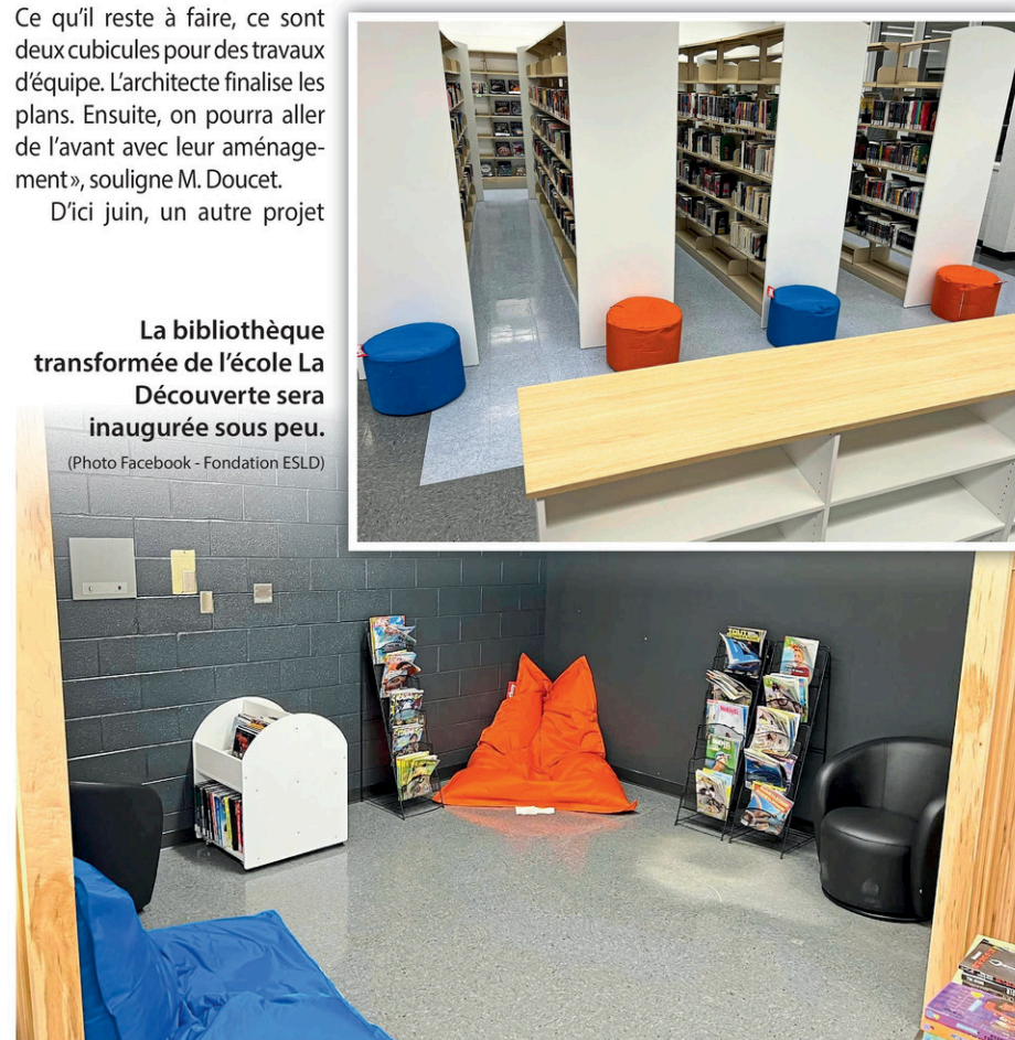
La bibliothèque transformée de l'école La Découverte sera inaugurée sous peu.