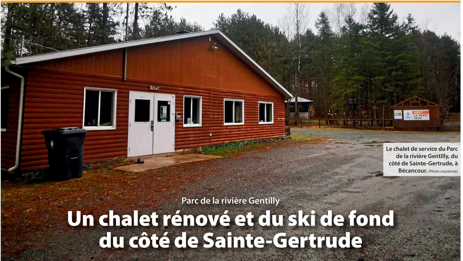
Le chalet de service du Parc de la rivière Gentilly, du côté de Sainte-Gertrude, à Bécancour.