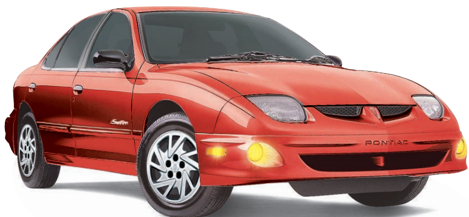
MODÈLES SL (2 ET 4 PORTES)