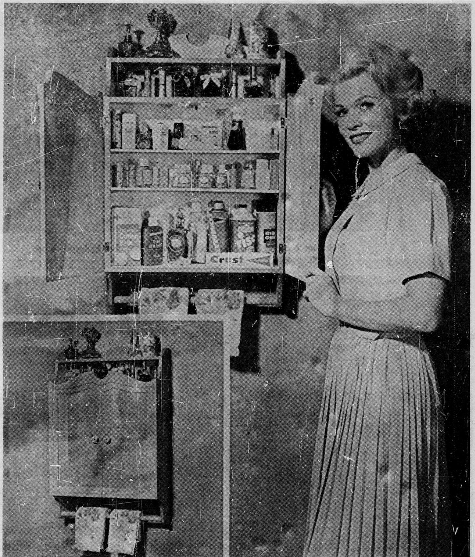
Cette armoire au mur sera très pratique pour y loger les médicaments ou les produits de beauté. Vous pouvez la faire vous-même facilement grâce au patron no 365. Vous n'avez qu'à envoyer 75¢ à Monitor Enterprises, 7005, Kildare Road, Montréal-29, Qué.

D'après une source autorisée du Vatican, l'Allemagne et le Saint-Siège seraient en voie de conclure un accord dans le but de sauvegarder les intérêts des catholiques dans les territoires annexés par l'Allemagne.