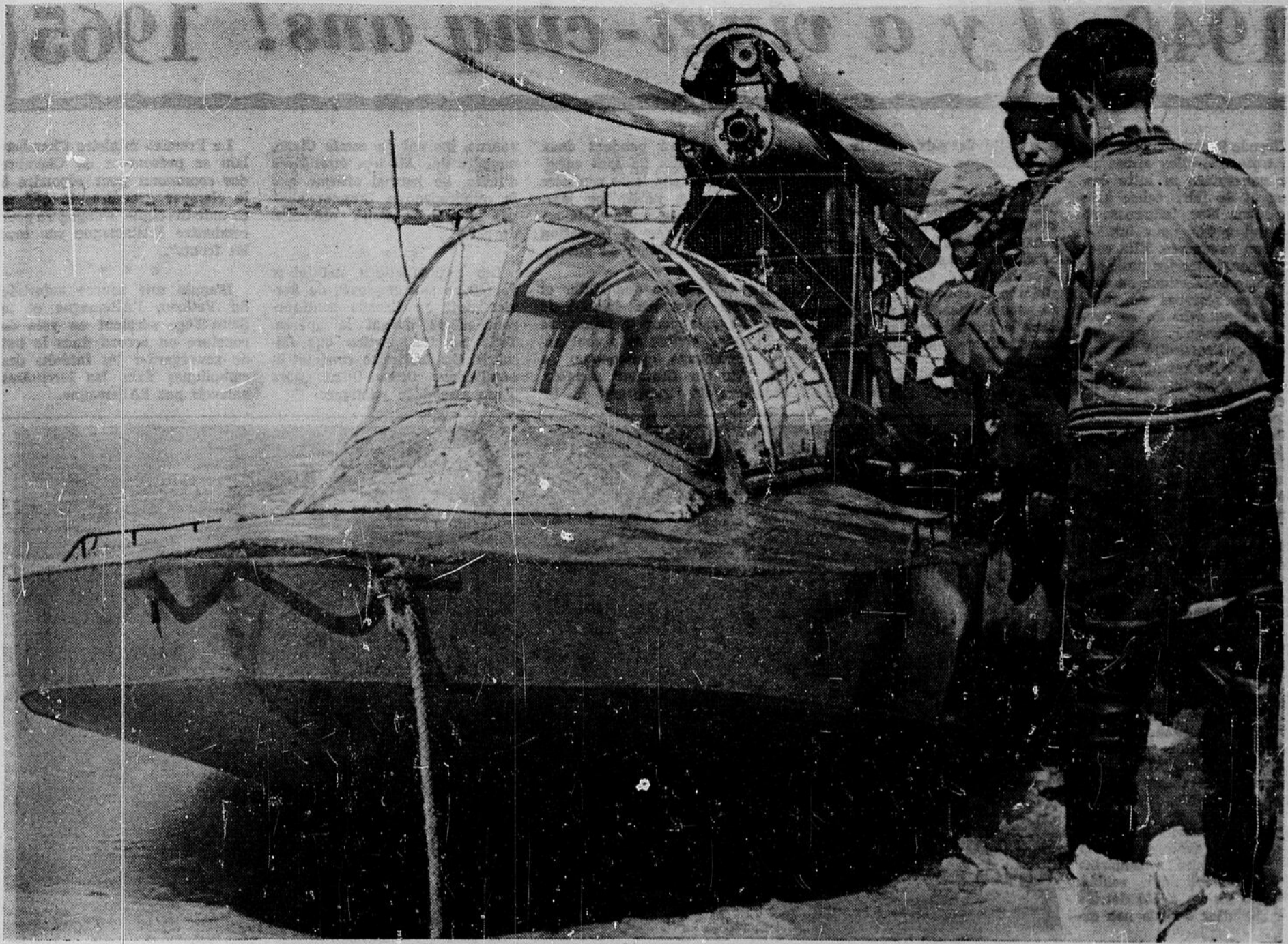
Voici un modèle de ces avions qui sont plutôt des hydroglisseurs.