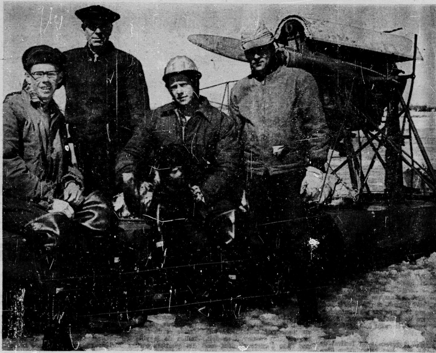
L'équipe des insulaires à l'île Bouchard.