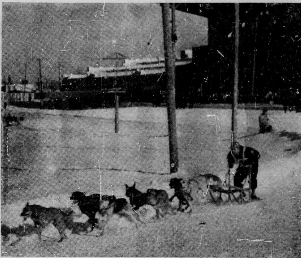
Une course de chiens...

ginaux ont même eu l'idée d'organiser une course assez surprenante: des traîneaux de fortune confectionnés avec de vieilles caisses à savon et attelés de chiens. Puis à la fin du dernier jour, un petit feu d'artifice et un copieux banquet mettront un point final aux réjouissances officielles. Les gens de Le Pas seront sans doute heureux: ils auront eu "leur" festival, comme dans les pays de grand soleil et de ciel bleu, l'unique grand festival du Nord Canadien!