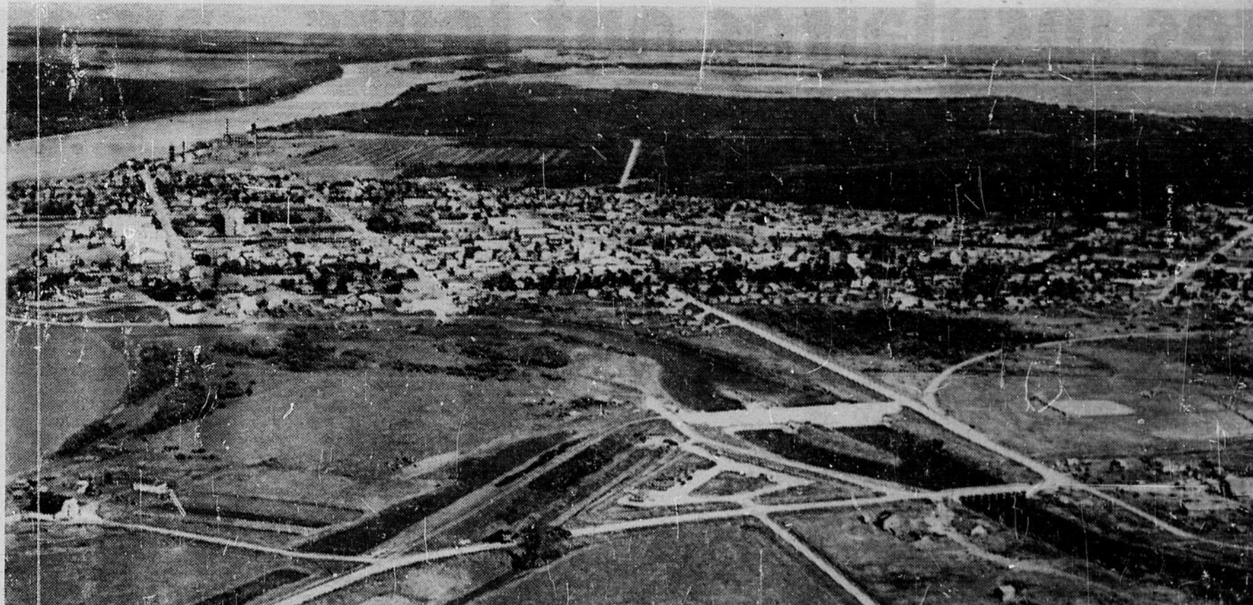
Une vue à vol d'oiseau de la ville de "Le Pas" au Manitoba.