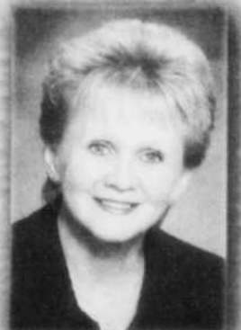
NOËLLA CHAMPAGNE DÉPUTÉ DE CHAMPLAIN