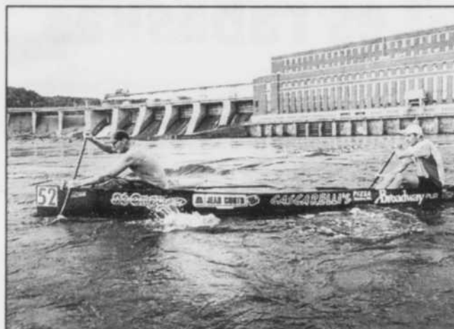
L'équipe Lajoie-Triebold au portage de La Gabelle lors de l'édition 2003 de la Classique internationale de canots.