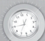
Gagnez du temps