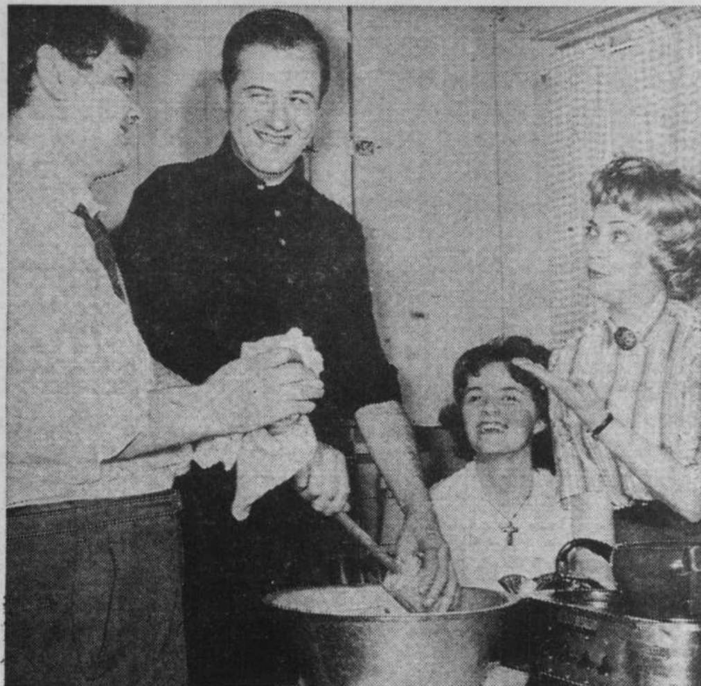
Le plaisir de laver la vaisselle... sans trop grincer des dents.