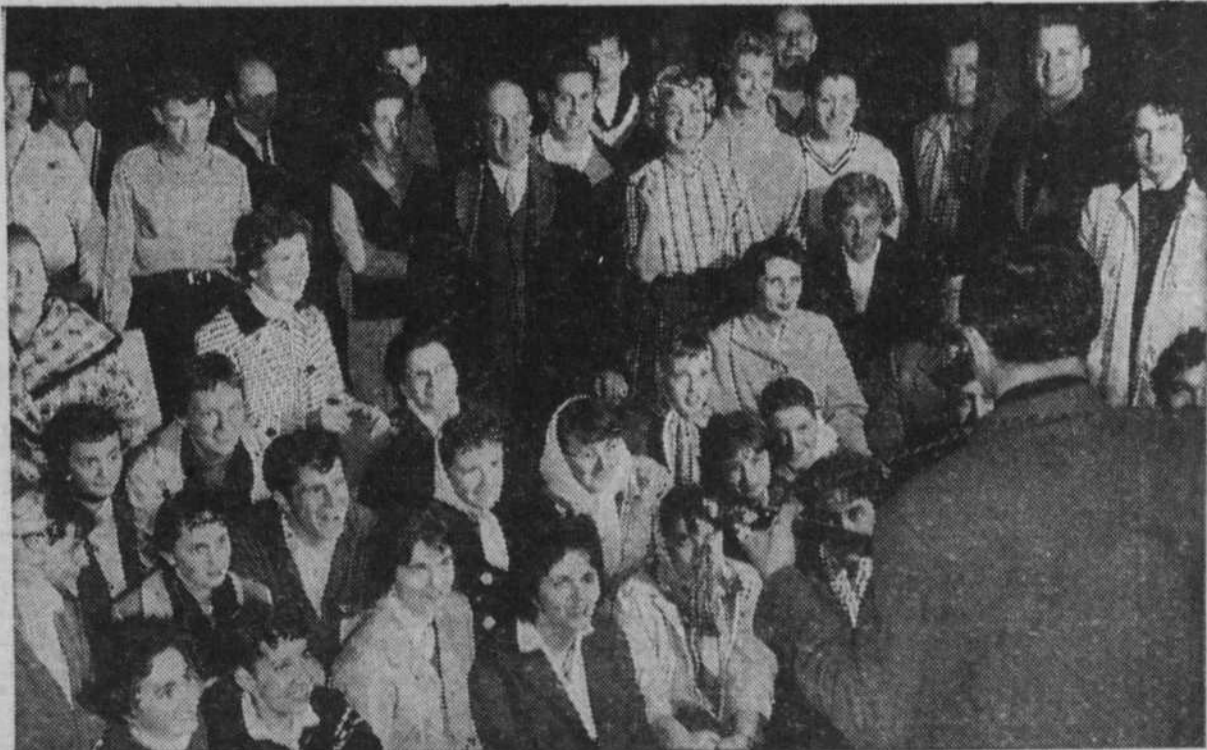
Pour un auditoire ravi, un court spectacle terminait la partie de sucre.