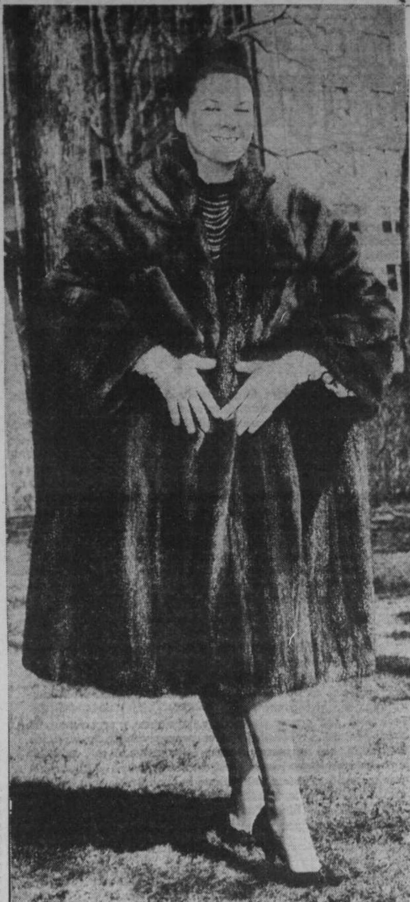
Quatre-vingt-deux peaux de vison mâle ont servi pour la confection de cette superbe pelisse. L'art français au service du vison canadien, quel merveilleux assemblage!

Bonnes conditions, congés nombreux et salaire intéressant. Qui veut profiter de l'offre, doit téléphoner au '400', à VI. 2-6345.