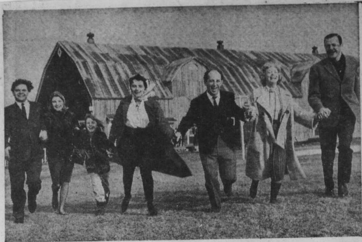
Main dans la main pour courir "aux sucres".