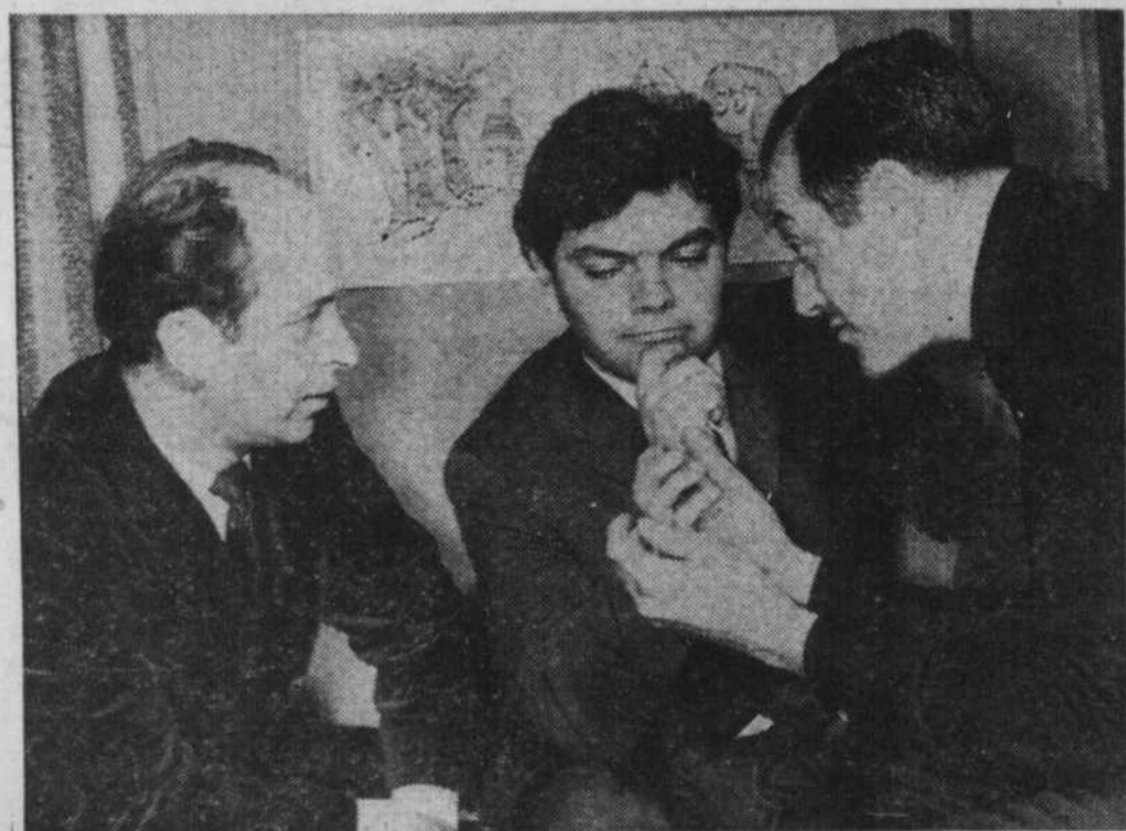
Méfiez-vous : ils ont une mine de conspirateurs.