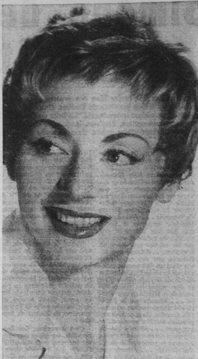
Annie Cordy fera trembler (à la Maurice Richard) les murs du Forum.