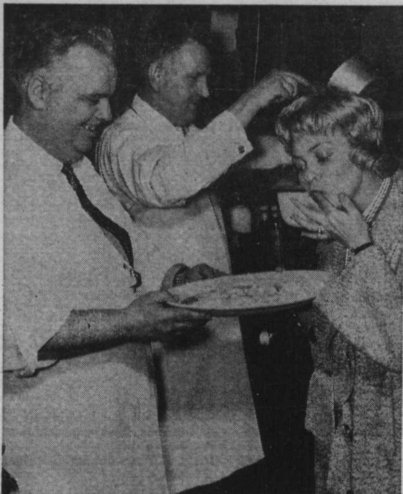
Les oeufs au sirop, quel délice!