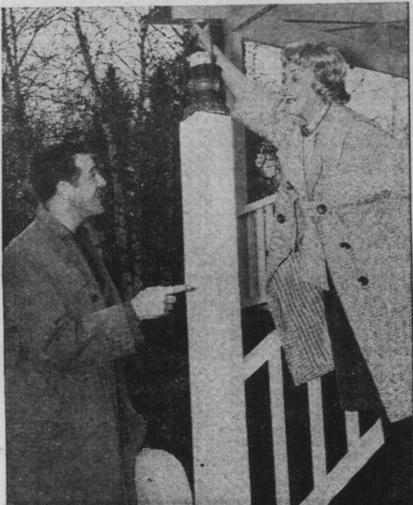
J'arrive de "Cocou"; c'est bien ici la partie de sucre ?

C'est dans une gr la beauté et le char données les diverses saison. Un cadre rust