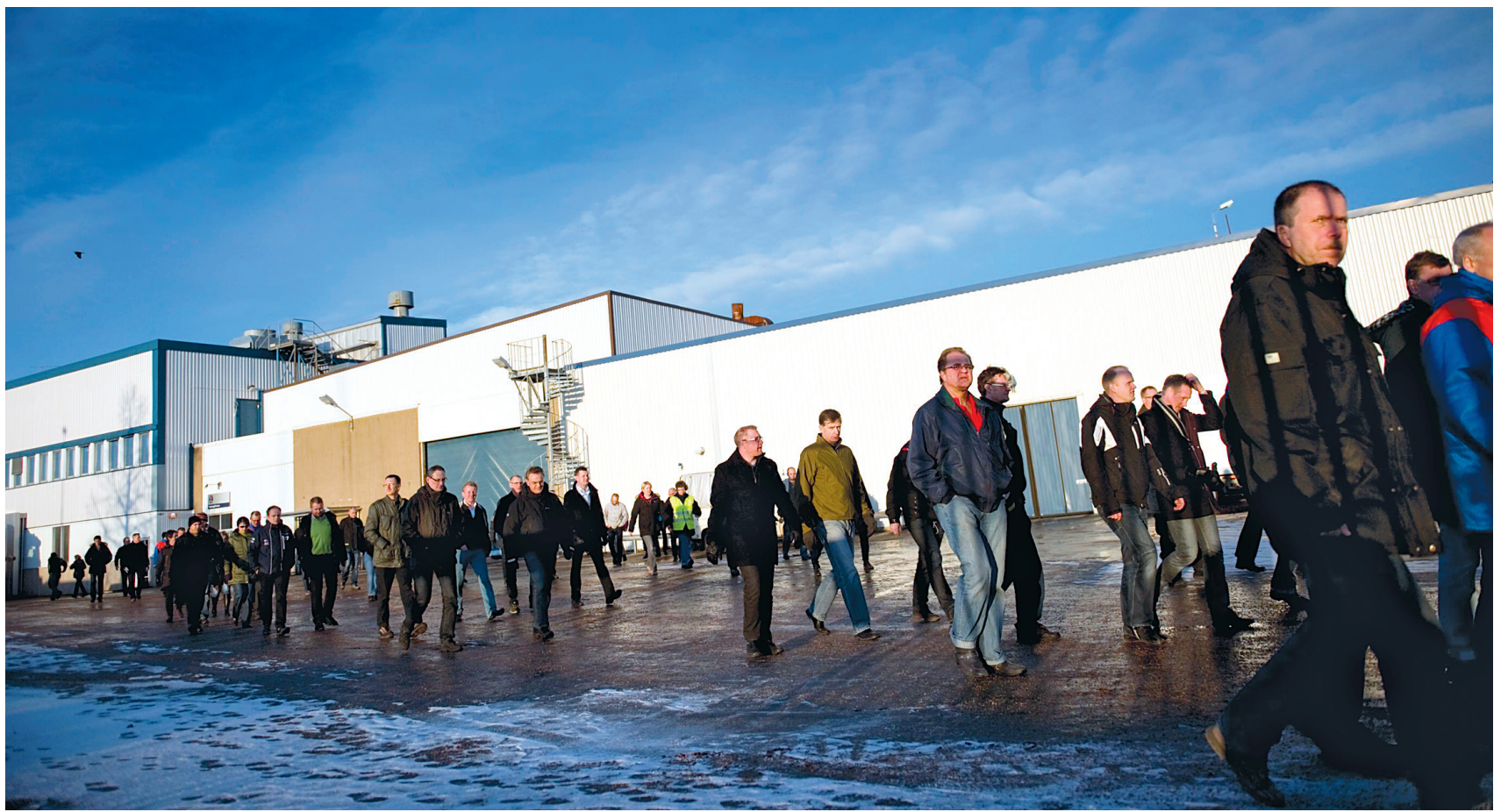
Des travailleurs de Saab quittent l'usine de Trollhättan, en Suède, après avoir été informés de la faillite de l'entreprise.