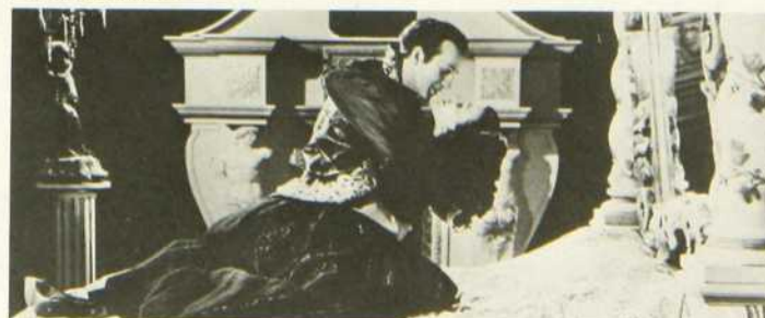
L'Oeil du Diable