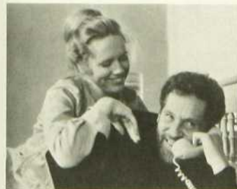
Liv Ullman et Erland Josephson