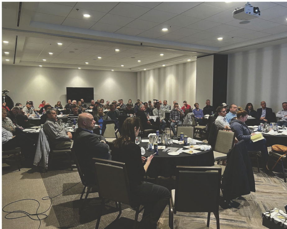
L'Assemblée générale annuelle des Éleveurs de porcs de la Montérégie s'est tenue au Centre de congrès de Saint-Hyacinthe.