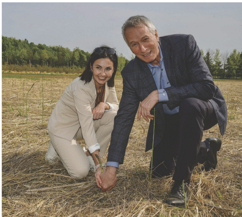
Le ministre de l'Agriculture, André Lamontagne, et la députée de Saint-Hyacinthe, Chantal Soucy, ont profité de leur visite à la ferme Équinoxe pour cueillir une asperge afin d'inaugurer la belle saison des produits frais et locaux.

Par le fait même, il sera possible d'explorer de nouvelles avenues afin d'assurer la sécurité alimentaire du Québec », a-t-il conclu.