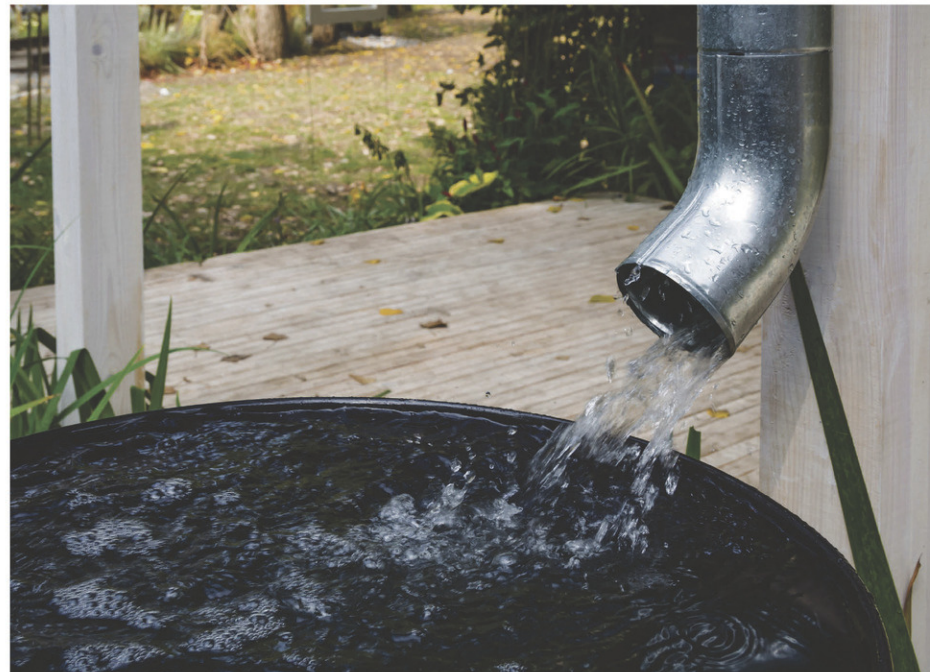
La Ville de Saint-Hyacinthe offre une subvention à ses résidents désirant se doter d'un baril récupérateur d'eau de pluie.