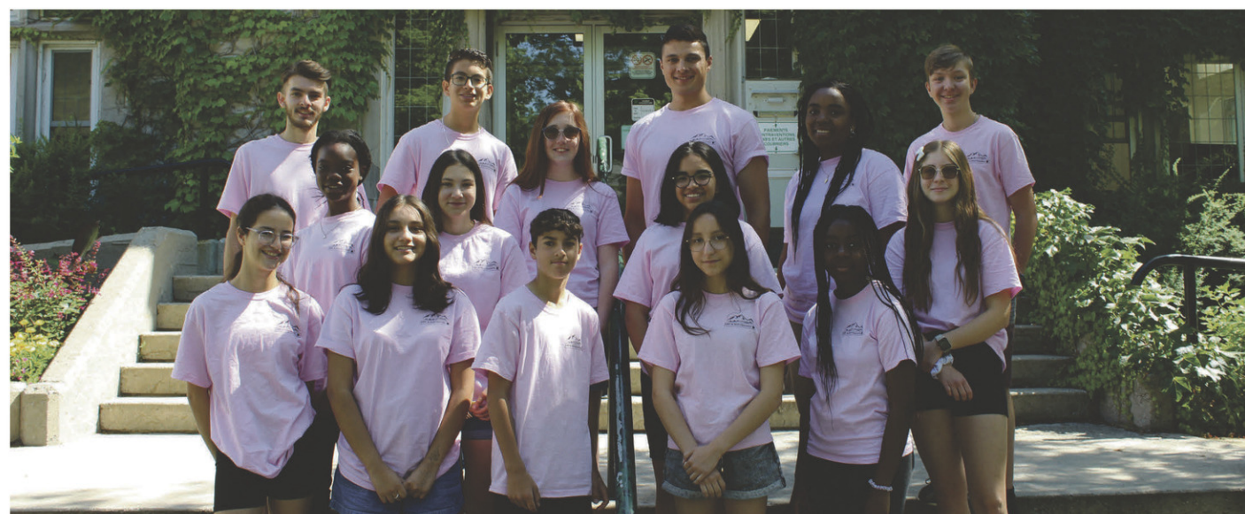
Les coopérants de la CIEC 2022 avec leurs coordonnateurs.

Prévisions météo détaillées pour Saint-Hyacinthe 450 771-beau (2328) aussi sur lecourrier.qc.ca