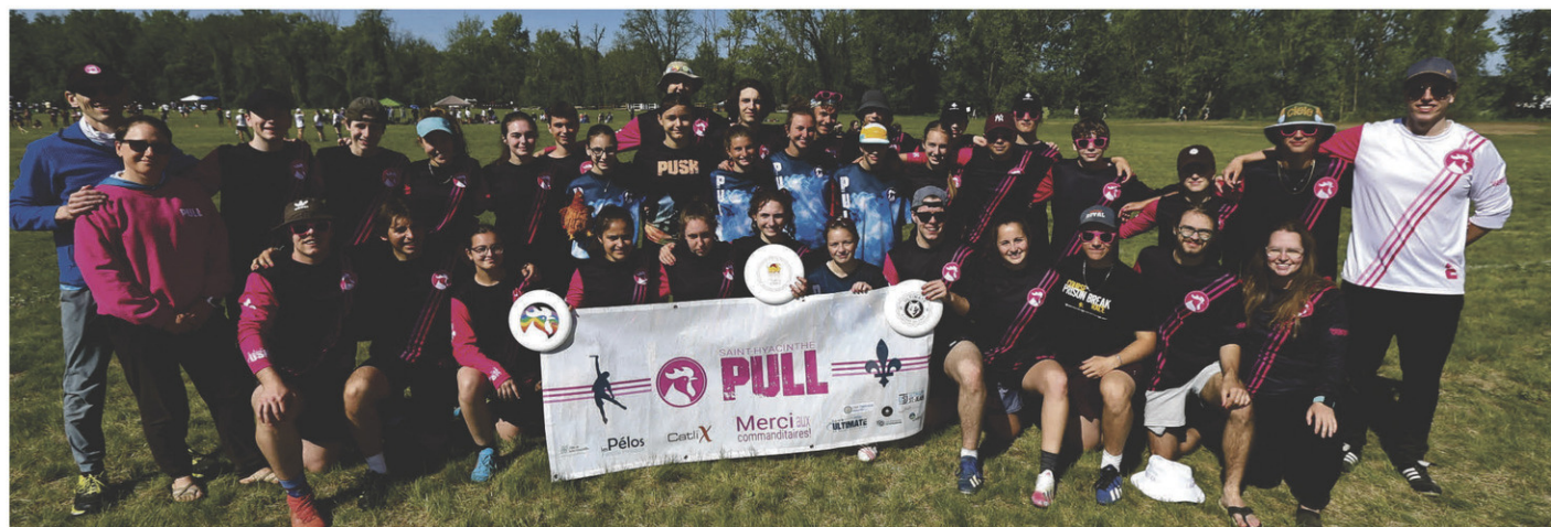
En plus de retourner au Pioneer Valley Invitational avec son équipe masculine, PULL a pu faire vivre l'expérience de ce tournoi américain à son équipe féminine pour la première fois.