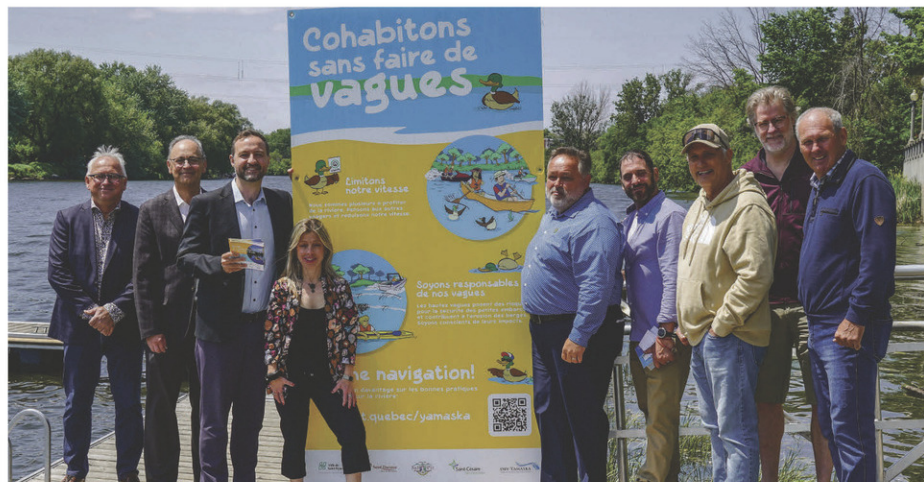
La campagne de sensibilisation « Cohabitions sans faire de vagues » du Comité Yamaska vient d'être lancée.

Des exemplaires du guide ont été envoyés par la poste à tous les résidents des quatre villes concernées et sont également disponibles auprès des administrations municipales et aux bureaux des deux