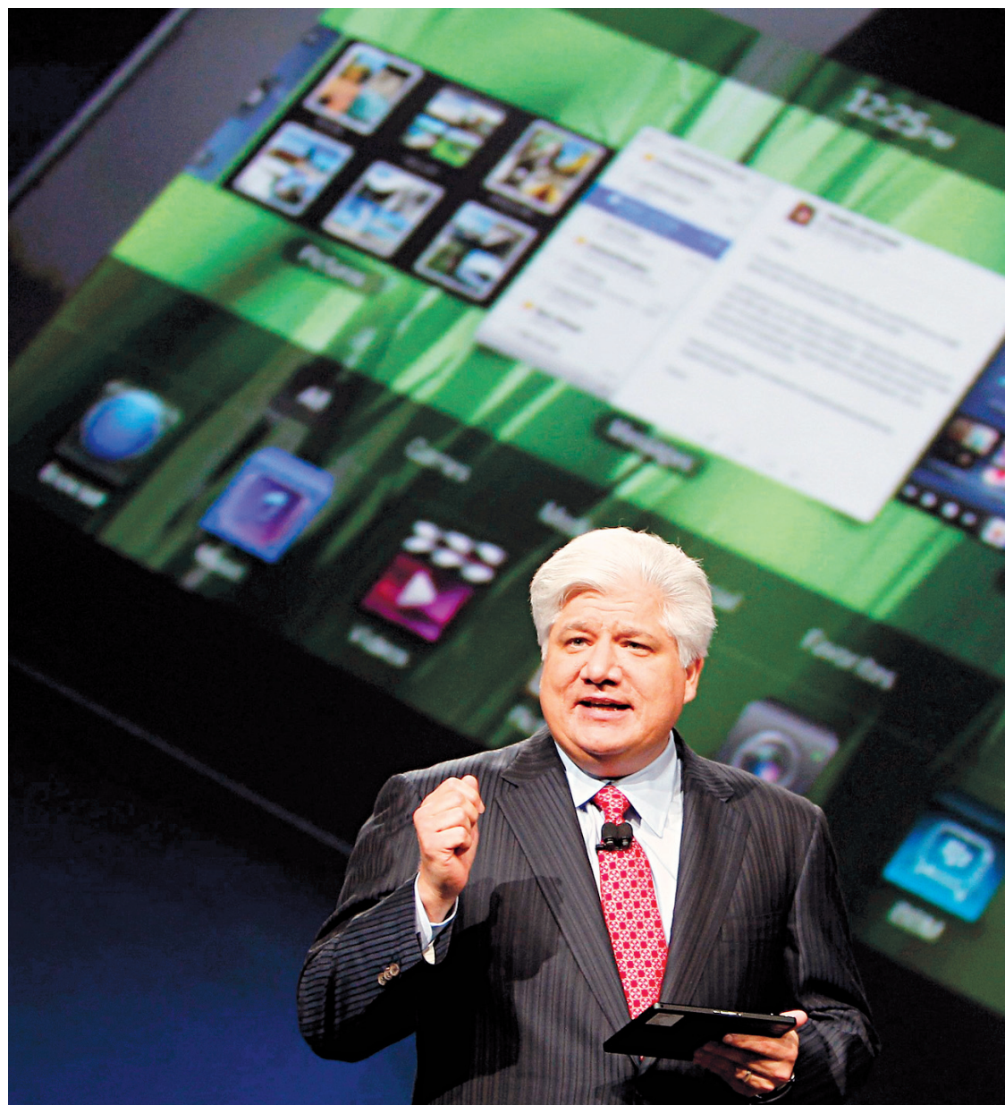
Mike Lazaridis, le président de Research in Motion, lors d'une présentation de son PlayBook.