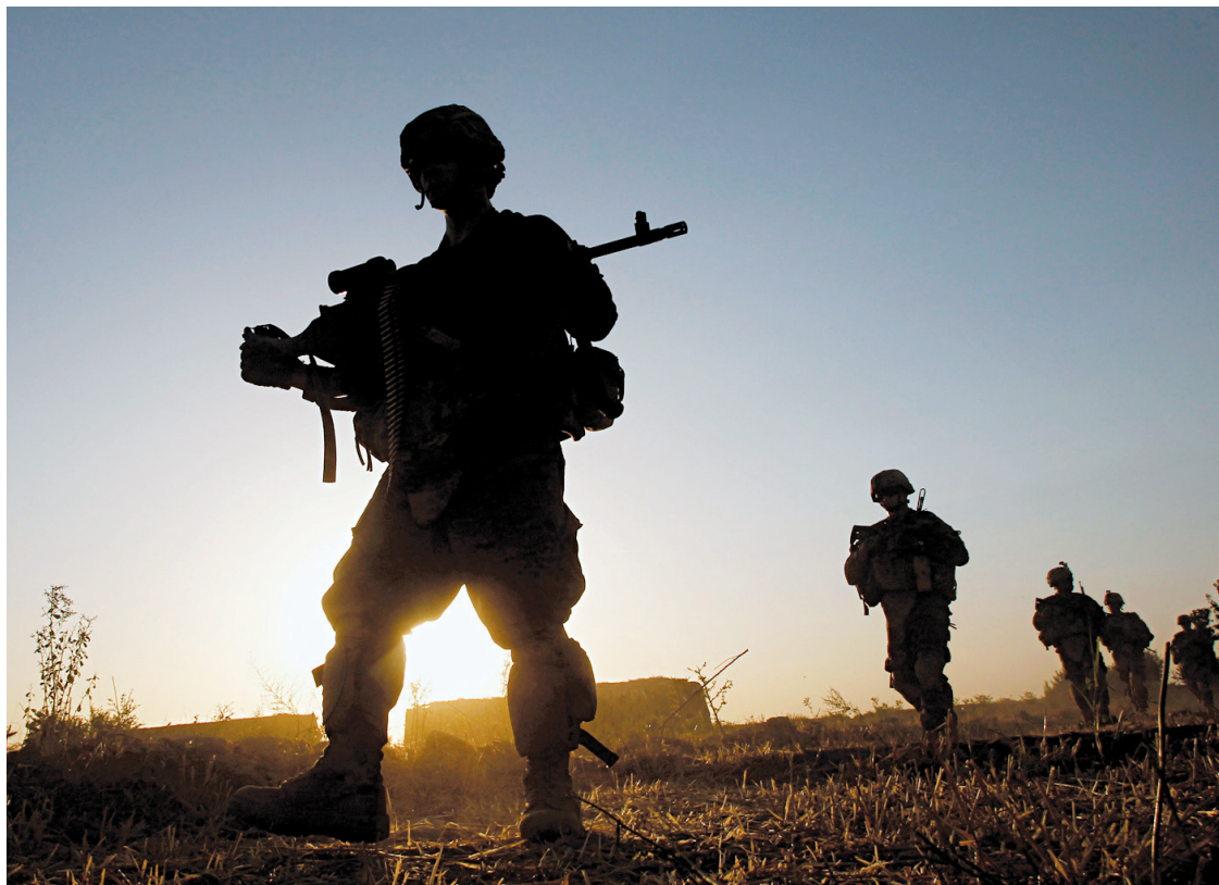
Soldats américains de la Charlie Company dans le district de Panjwai près de Kandahar

Dubaï — Un tribunal spécial de Bahreïn a condamné hier à la perpétuité huit opposants chiites ayant animé la contestation contre le pouvoir sunnite qui s'apprête à engager un dialogue national destiné à relancer un processus de réformes. Les huit condamnés font partie de l'opposition radicale qui a ouvertement appelé pendant la contestation (mi-février/mi-mars) au départ de la vieille dynastie sunnite des Al-Khalifa et à l'instauration d'une république. — AFP