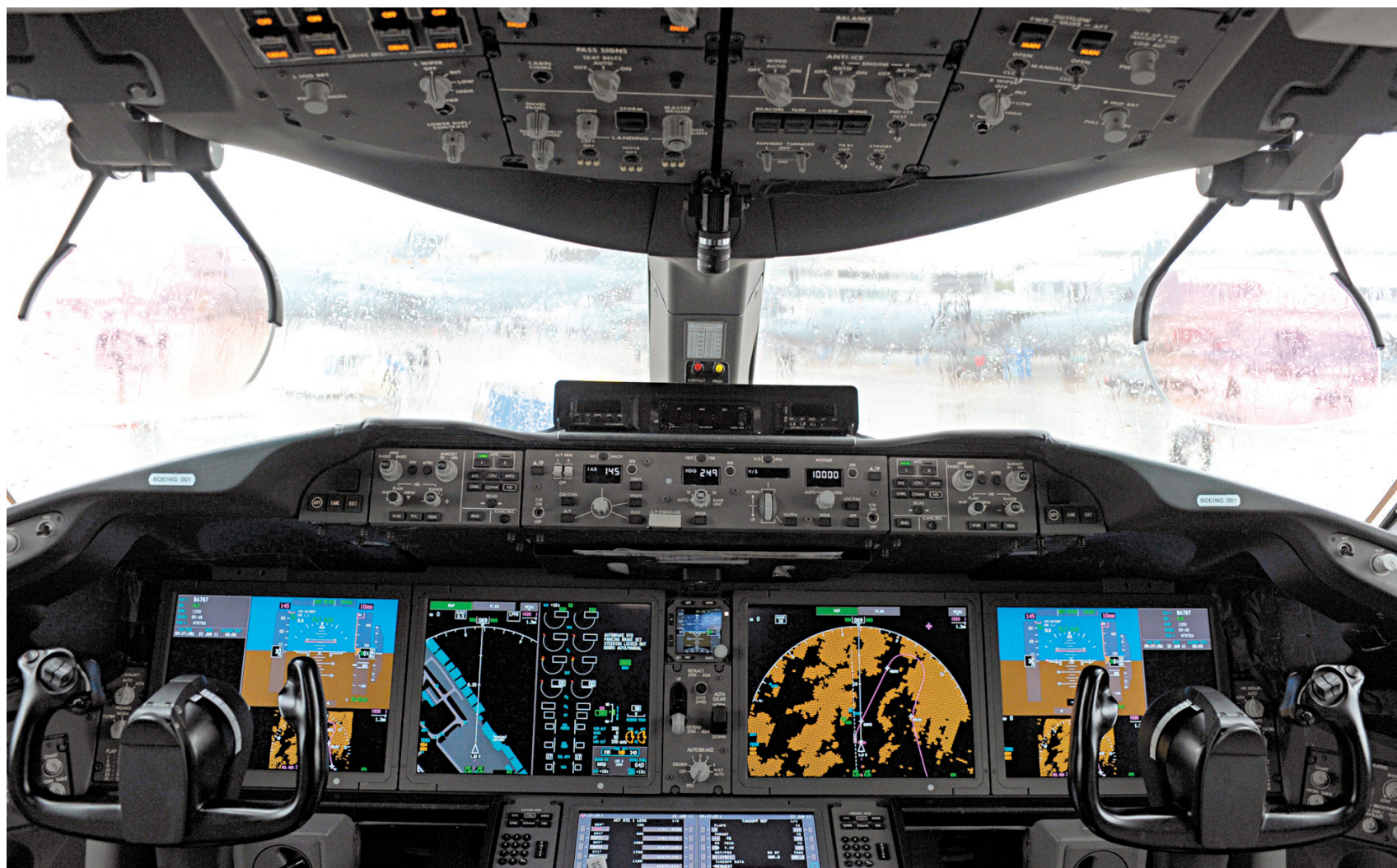
Vue de l'intérieur du cockpit du Dreamliner de Boeing.