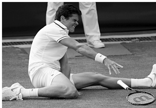
Milos Raonic s'est blessé à la cuisse droite après une glissade en tout début de match.

«Je ne sais pas du tout ce que c'est, a ajouté Raonic. Il est beaucoup trop tôt pour tenter un diagnostic.