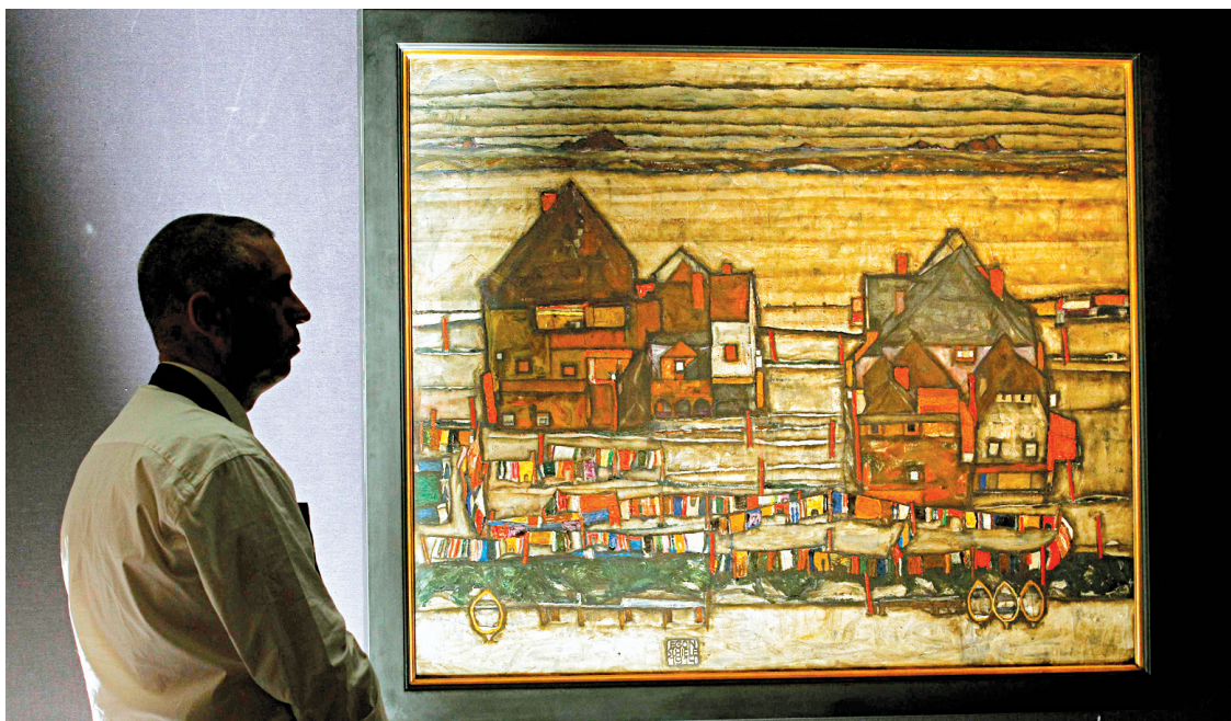
Häuser mit bunter Wäsche (Vorstadt II) (maison avec lessive, banlieue II), du peintre Egon Schiele, a été mis en vente par le Musée Leopold de Vienne.