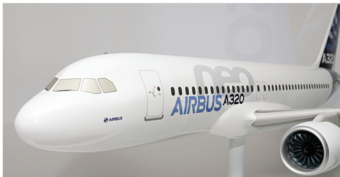
Un modèle de l'A320 d'Airbus