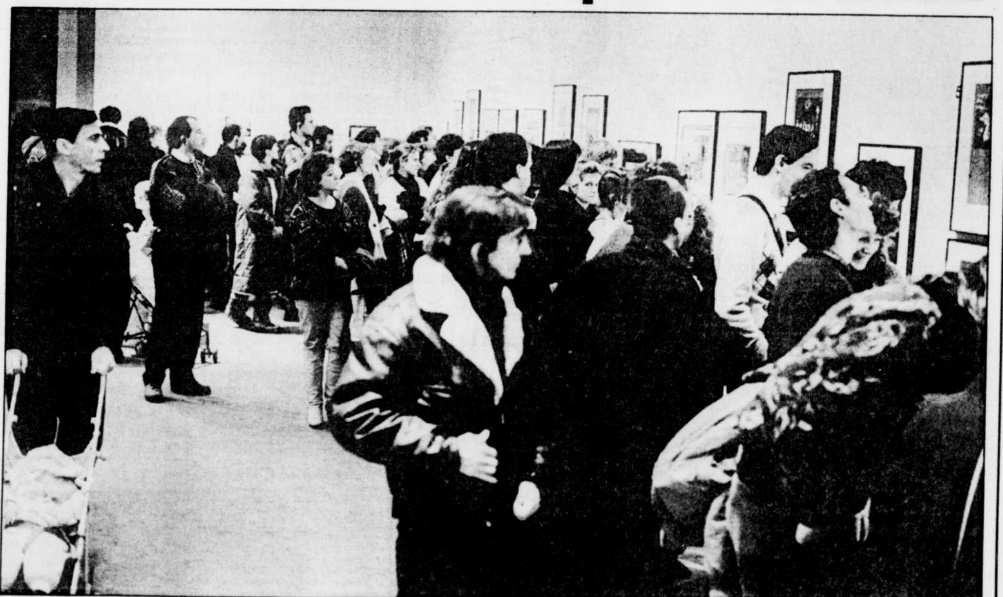
Le regain un peu tardif de popularité à l'égard des collages de Jacques Prévert n'aura pas suffi à atteindre l'objectif prévu de 100,000 visiteurs. Mais la direction du Musée du Québec retient la leçon : plus question d'organiser une telle exposition pendant la période de magasinage des Fêtes.

« Cette période-là », c'est la mi-novembre. Depuis le 26 décembre en effet, on a noté une affluente accrue et régulière au Musée du Québec : environ 800 visiteurs cha-