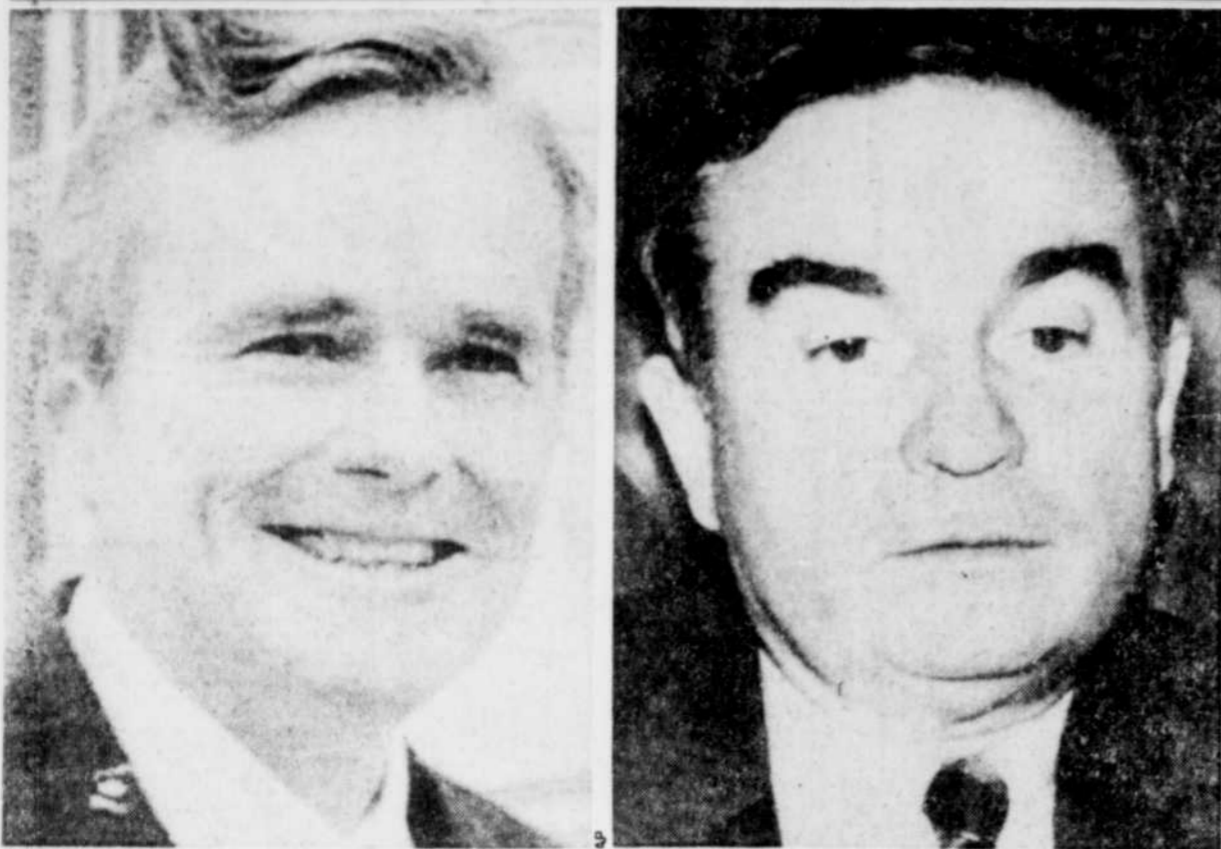
L'ex-sénateur Nicholas Brady présidait la commission sur le krach de 1987 et le président du New York Stock Exchange, John J. Phelan estime que le krach peut se reproduire.