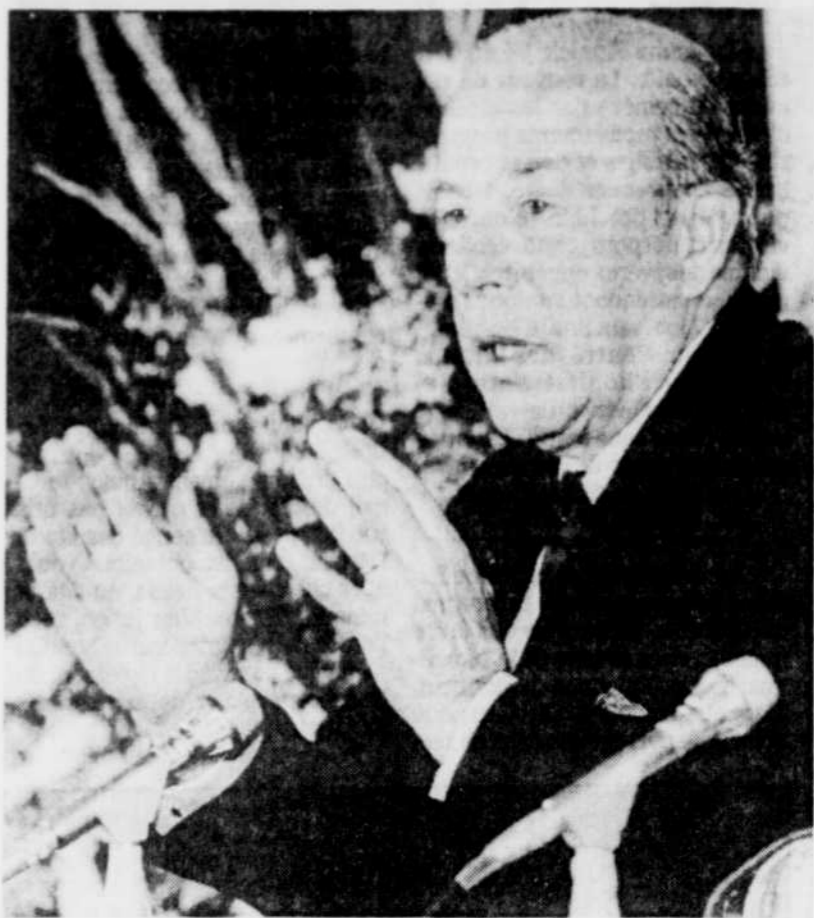
Le secrétaire d'État américain George Shultz signera, aujourd'hui à Ottawa, des ententes concernant l'extradition de criminels, la lutte au terrorisme et la coopération dans l'Arctique.

Le libre-échange sera aussi au menu. On prévoit que M. Clark demandera à son homologue américain de contribuer à ce que le Congrès ratifie rapidement l'entente et que le Canada soit préservé des mesures protectionnistes qui pourraient être adoptées aux États-Unis avant que l'accord de libre-échange n'entre en vigueur. ●