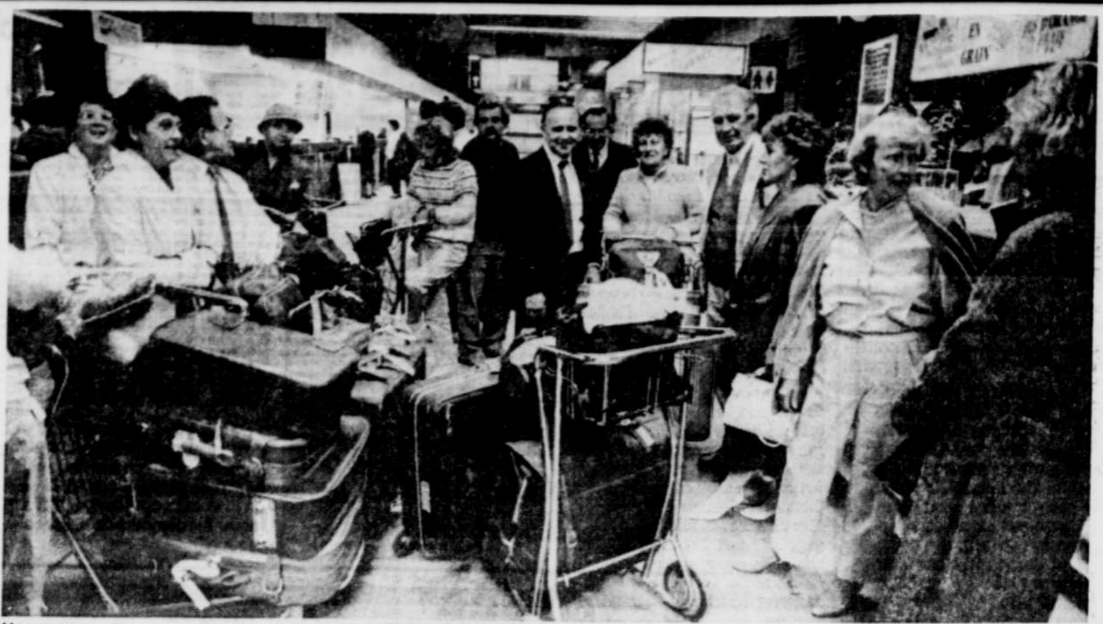
Une autre malheureuse aventure pour 48 passagers de Minerve Canada...