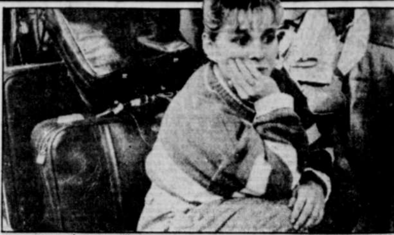
Une passagère en attente...