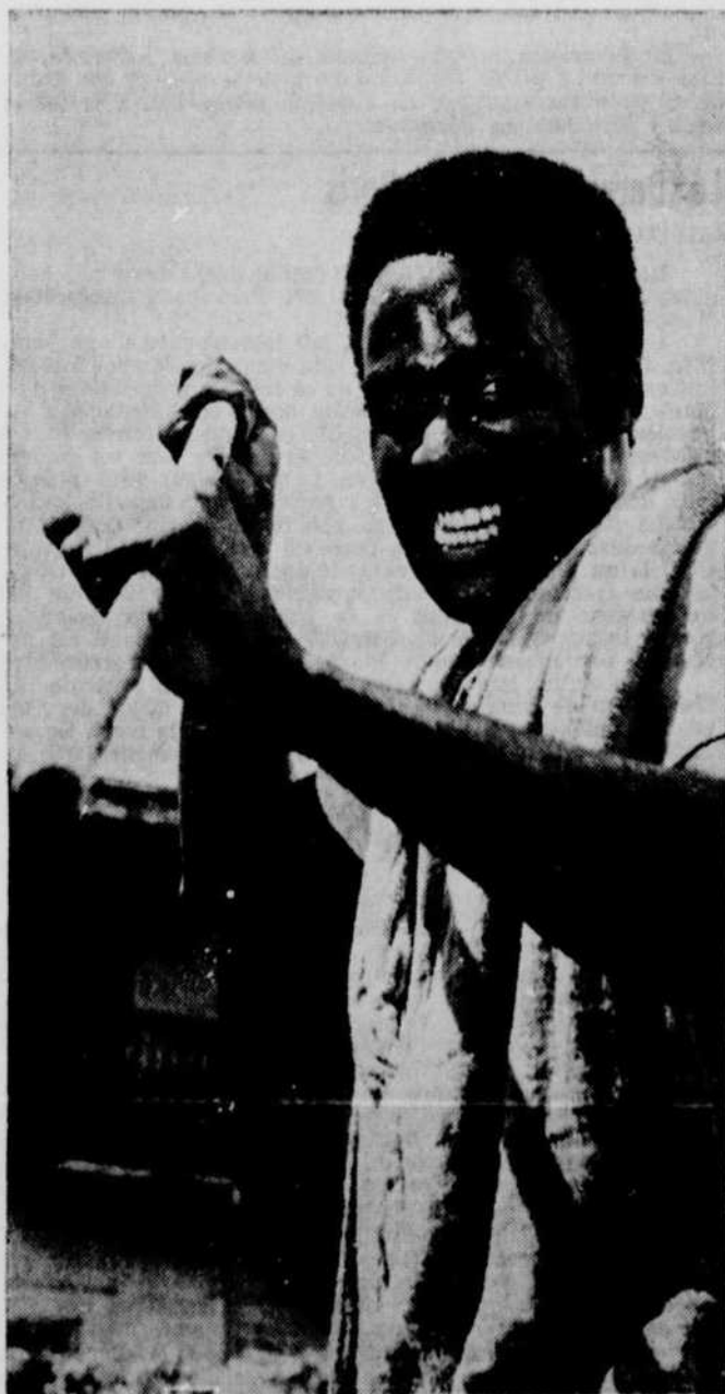
"Les nuits rouges de Harlem" réalisé par Gordon Parks et mettant en vedette Richard Roundtree (sur la photo) ainsi que Moses Gunn, Christopher St. John et Charles Cioffi. Présenté aux cinémas CARTIER ET LAIRET. ■

A la fin du texte est indiqué, quand il y a lieu, la convenance pour les jeunes: (e) enfants; (a) adolescents.