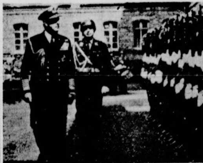
C'est dimanche 22 juillet dans le cadre des Beaux Dimanches de Radio-Canada que Lord Mountbatten raconte sa vie en quatre épisodes. Sur la photo, il inspecte les Forces de l'Allemagne de l'Ouest.