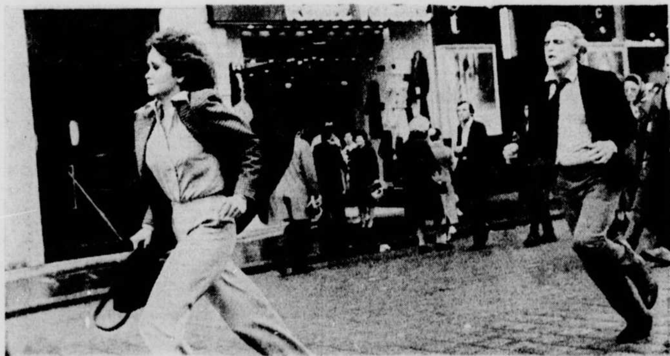
Dans le film "Le dernier tango à Paris" Marlon Brando trouve l'occasion d'une remarquable création même si le scénario donne lieu à un dialogue cru et à des scènes très audacieuses.

Ce dépliant est à conserver toute la semaine pour de bonnes informations sur les films qui passent dans nos salles de cinémas et sur les émissions de télévision.