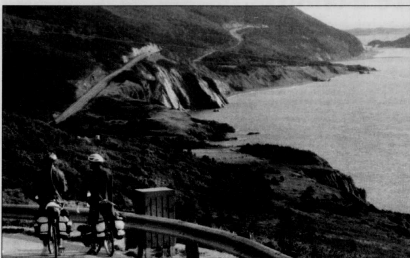
La «Cabot Trail», une des plus belles routes panoramiques au monde.

randonnée où l'air est pur, les cours d'eau clairs et où vous pourriez rencontrer un ours noir ou un original s'abreuvant à un point d'eau.