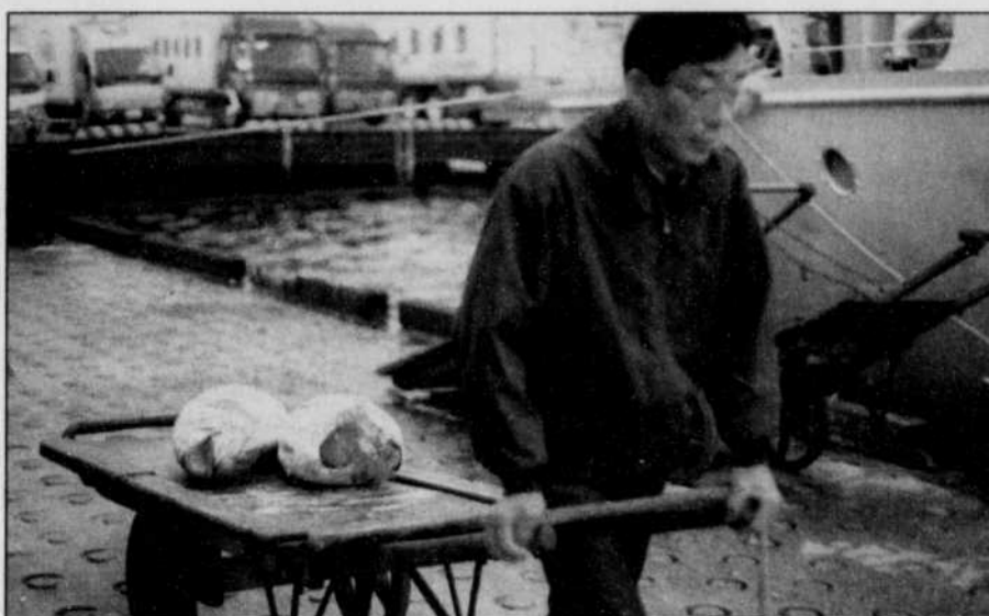
Stôt vendu, stôt dépecé, le thon, provenant d'un peu partout au monde, ne mettra que quelques heures à se retrouver sur une table d'hôte nippon.

■ TOKYO — Cinq heures trente du matin et une rumeur sourde monte d'une série de hangars qui ne paient pas de mine. Quelques milliers de personnes sont en pleine journée de travail et il faut faire attention où on met les pieds pour ne pas se les faire écraser. Nous sommes au marché de poissons Tsukiji, à l'immense marché de poissons qui nourrit Tokyo et ses 12 millions d'habitants.