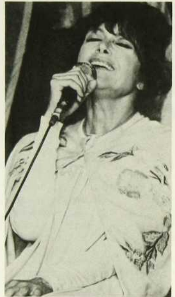
... «La Sauceuse de chocolat»...