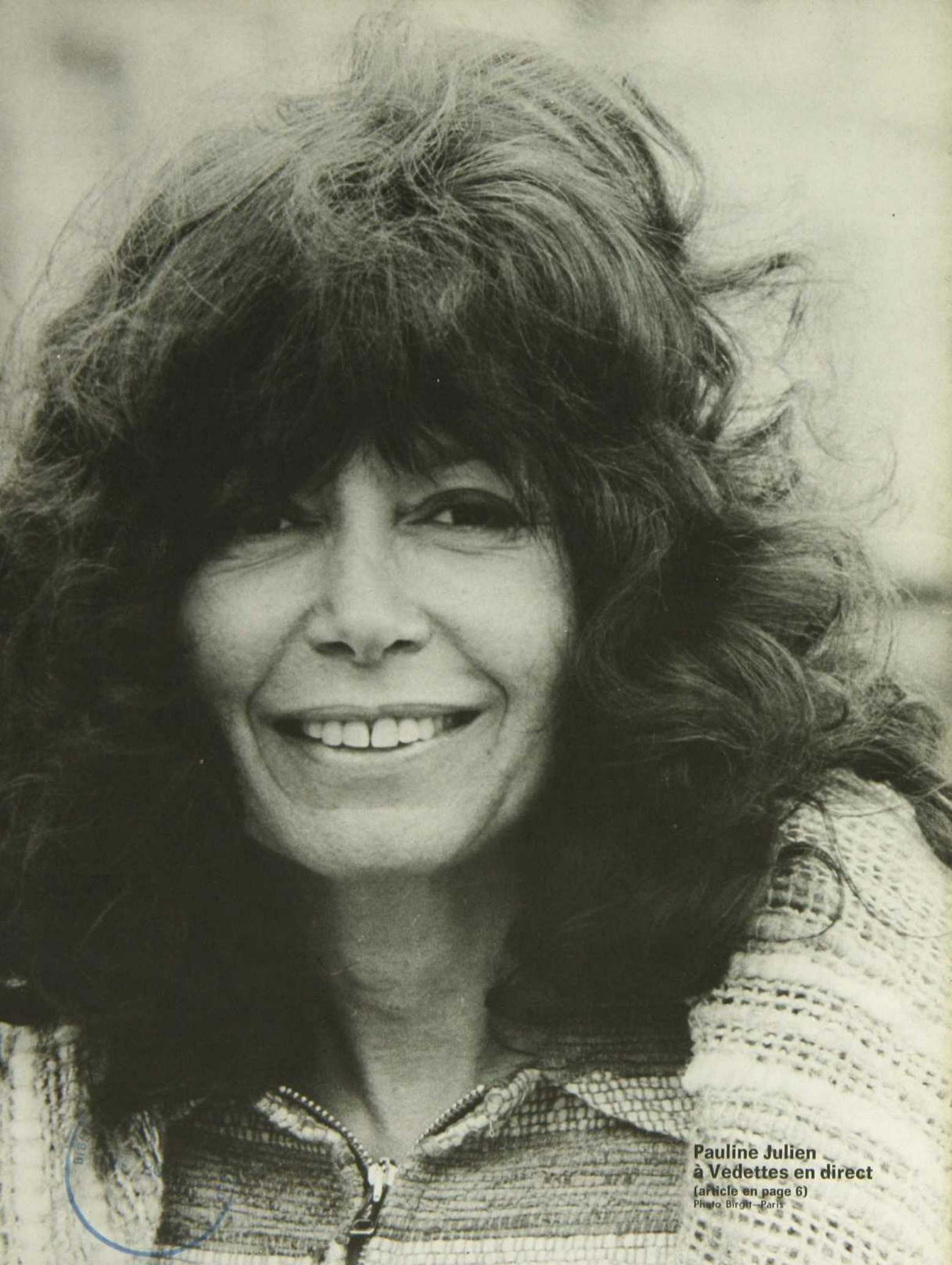
Pauline Julien à Vedettes en direct (article en page 6)