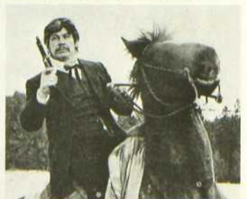
Le Solitaire de Fort Humboldt

Auteur de nombreux romans policiers ou d'espionnage, l'écrivain britannique Alistair MacLean s'essaie pour la première fois à une intrigue située dans le cadre de l'Ouest américain. Cela donne un curieux western à suspense où une énigme compliquée fait bon ménage avec des scènes d'action. Le décor du train en marche est fort bien utilisé, avec une grande variété de prises de vues tant extérieures qu'intérieures. L'intérêt ne faiblit pas et la distribution groupe de bons comédiens autour d'un Charles Bronson en pleine forme.