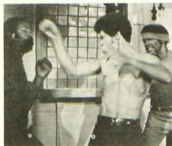
La Ceinture noire

Après avoir réalisé Enter the Dragon , dans lequel il imitait avec succès les recettes des films chinois centrés sur les arts martiaux, Robert Clouse en transpose maintenant les éléments habituels en sol américain. Il a eu la sagacité de traiter son sujet dans un ton humoristique et d'accentuer les aspects grotesques et outranciers de l'aventure, si bien que l'aspect divertissement de son film en fait oublier certaines invraisemblances.