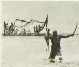
Juliette des esprits

Continuant à oeuvrer dans le style ésotérique et flamboyant de 8 1/2 , Fellini a réalisé un film d'une opulence visuelle remarquable. Le plaisir évident qu'il met à figurer ses visions insolites cache cependant un certain appauvrissement de thèmes voués à la répétition. Tout en s'interrogeant sur leur signification, le téléspectateur pourra s'amuser à voir défiler les fantasmes extravagants de l'imagination de l'héroïne qui semblent refléter fidèlement les habituelles inventions baroques de l'auteur.