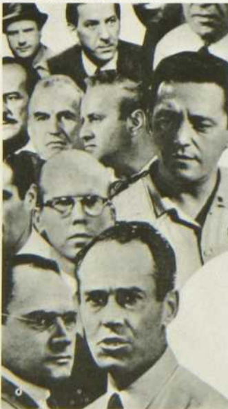
Douze hommes en colère

Lors d'un procès en cour d'assises, un adolescent de dix-huit ans, accusé du meurtre de son père, fait face à douze jurés qui ont à se prononcer sur sa culpabilité ou son innocence. Quant au juge, il croit qu'un doute raisonnable devrait les amener à rendre le verdict de non-culpabilité. Un seul de ces hommes opte pour ce jugement; cependant, le parti pris et l'arrogance de deux des jurés, qui se refusent à considérer les points faibles de l'argumentation contre l'accusé, ont pour effet de rallier les autres à la cause du jeune homme.