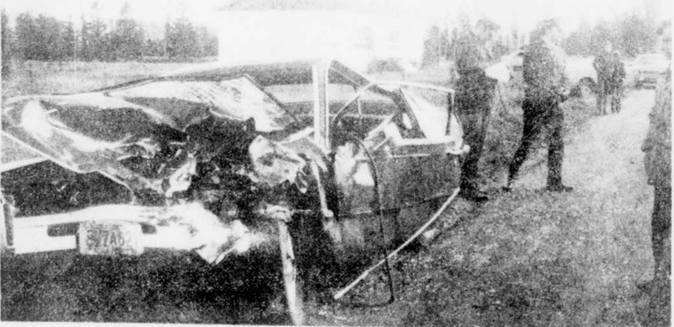
Une collision de deux automobiles qui s'est produite avec une violence inouïe sur l'avenue Pie X à Victoriaville, le 14 octobre, samedi midi, trois blessés, dont deux très grièvement. La photo du haut nous fait voir qu'une automobile Duster 1971 a eu la partie avant complètement sectionnée. La photo du centre nous fait voir l'avant de cette Dodge éparpillé en plusieurs morceaux, dans un champ, à plusieurs pieds du véhicule. Enfin, la photo du bas démontre ce qui reste d'une Maverick 1974, deuxième véhicule impliqué.