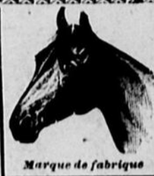
Marque de fabrique

Premier par le poids Premier par la qualité Premier par les résultats Premier sous tous rapports