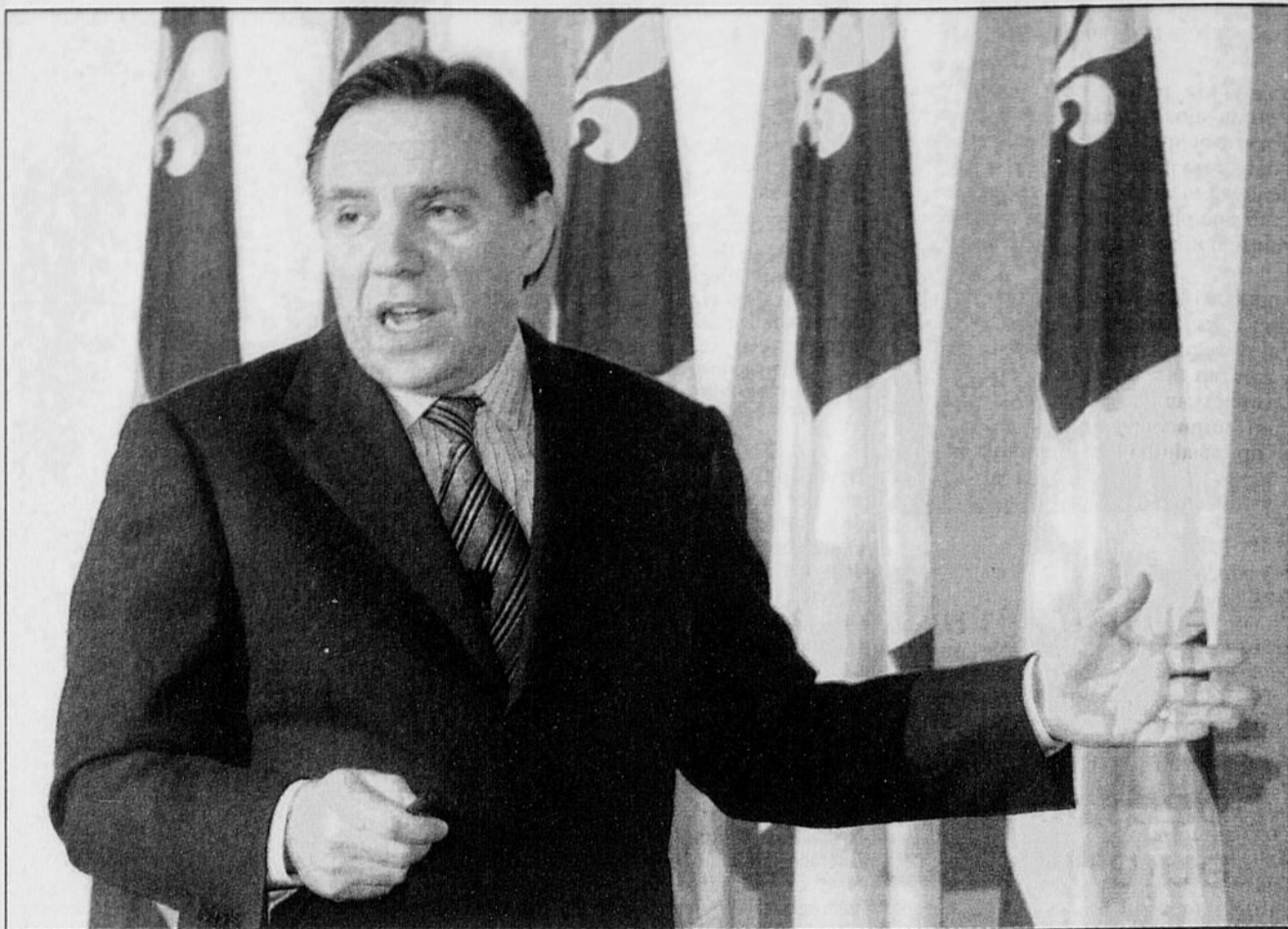
Après 18 mois de travail, François Legault a finalement révélé hier en conférence de presse son analyse des finances d'un Québec souverain. En devenant indépendant, le Québec réaliserait selon lui un surplus de 1,3 milliard de dollars la première année et de 5,3 milliards au bout de cinq ans.

Bernard Landry fonde de grands espoirs sur le document de François Legault. «Je pense que ça va solidifier notre position de façon extraordinaire. Certains ont des craintes matérielles au sujet de la souveraineté. On vient les rassurer», a-t-il affirmé.