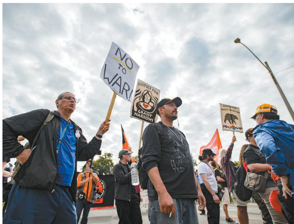
Des manifestants ont profité de la participation du premier ministre Justin Trudeau au défilé de la fête du Travail d'Hamilton, lundi, pour exprimer leur mécontentement.