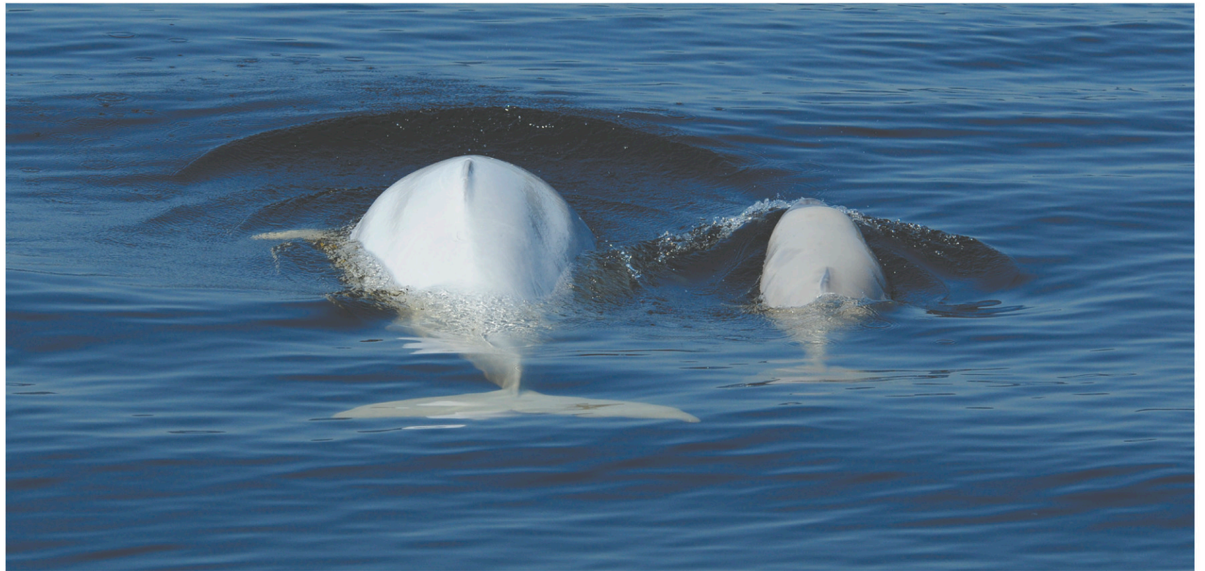
Selon Pêches et Océans Canada, les femelles et les jeunes bélugas sont les plus vulnérables à l'augmentation de la pollution sonore générée par le trafic maritime.

Qui plus est, le promoteur n'a pas utilisé des données concernant des méthaniers (des navires qui peuvent atteindre 300 mètres de longueur) pour