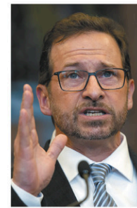
Le chef bloquiste lors d'un point de presse dans l'enceinte du parlement canadien, en mars dernier

Pas question non plus d'y voir une forme d'opposition entre le « nous » des Québécois et le « eux » du reste du Canada, prévient Yves-François Blanchet. « La campagne que je veux proposer en est une où le Québec va parler de sa propre voix, avec ses propres propositions, promet le chef du Bloc. Dans la relation entre le Québec et le Canada, s'il y a des choses que l'on voit