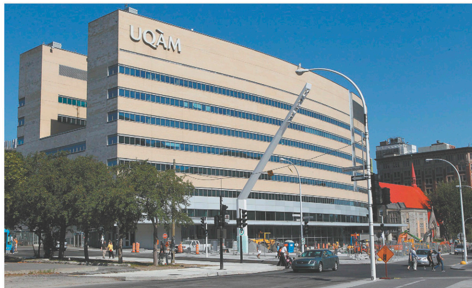
L'éducation ouvre les esprits et les émancipe de la propagande, rappelle l'auteur.

Quid de l'enseignement ? Il serait fuyant comme la peste par les professeurs de carrière, un labeur de soutier refilé à des contractuels condamnés à mettre les mains dans le cambouis. De professeurs en chair et en os, les infortunés étudiants ne verraient pas plus souvent que des étoiles filantes. Tout à leurs prestigieuses et rayonnantes occupations, ces notabilités auraient pris la poudre d'escampette des salles de classe.