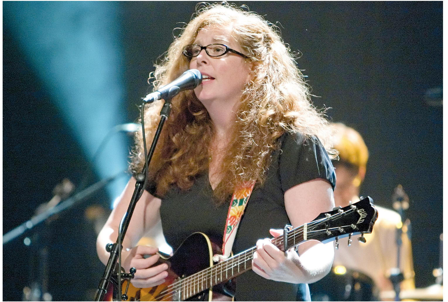
CLÉMENT ALLARD LE DEVOIR

Hier soir, Katie Moore a livré essentiellement des pièces de son disque Montebello , en soi une bulle folk bien confortable.