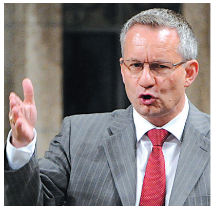
Le ministre canadien du Commerce international, Ed Fast

La filiale canadienne de la compagnie minière canadienne South American Silver exige des garanties de la Bolivie pour pouvoir travailler.