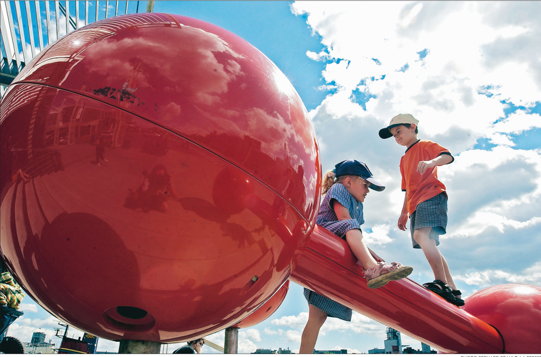
Des enfants profitent du beau temps pour escalader une sculpture dans le Vieux-Port de Montréal.