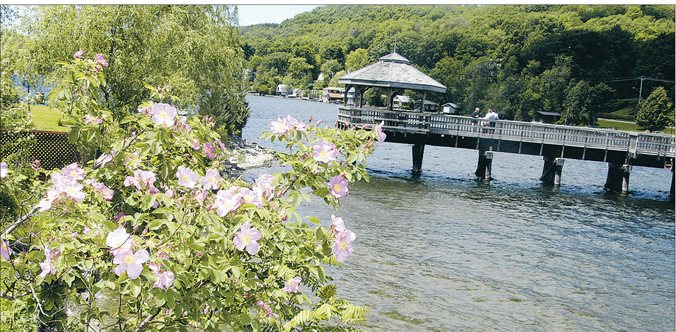
Des cyclistes prennent une pause au bord du lac Massawippi, à North Hatley, avant de reprendre la piste cyclable des Grande-Fourches.