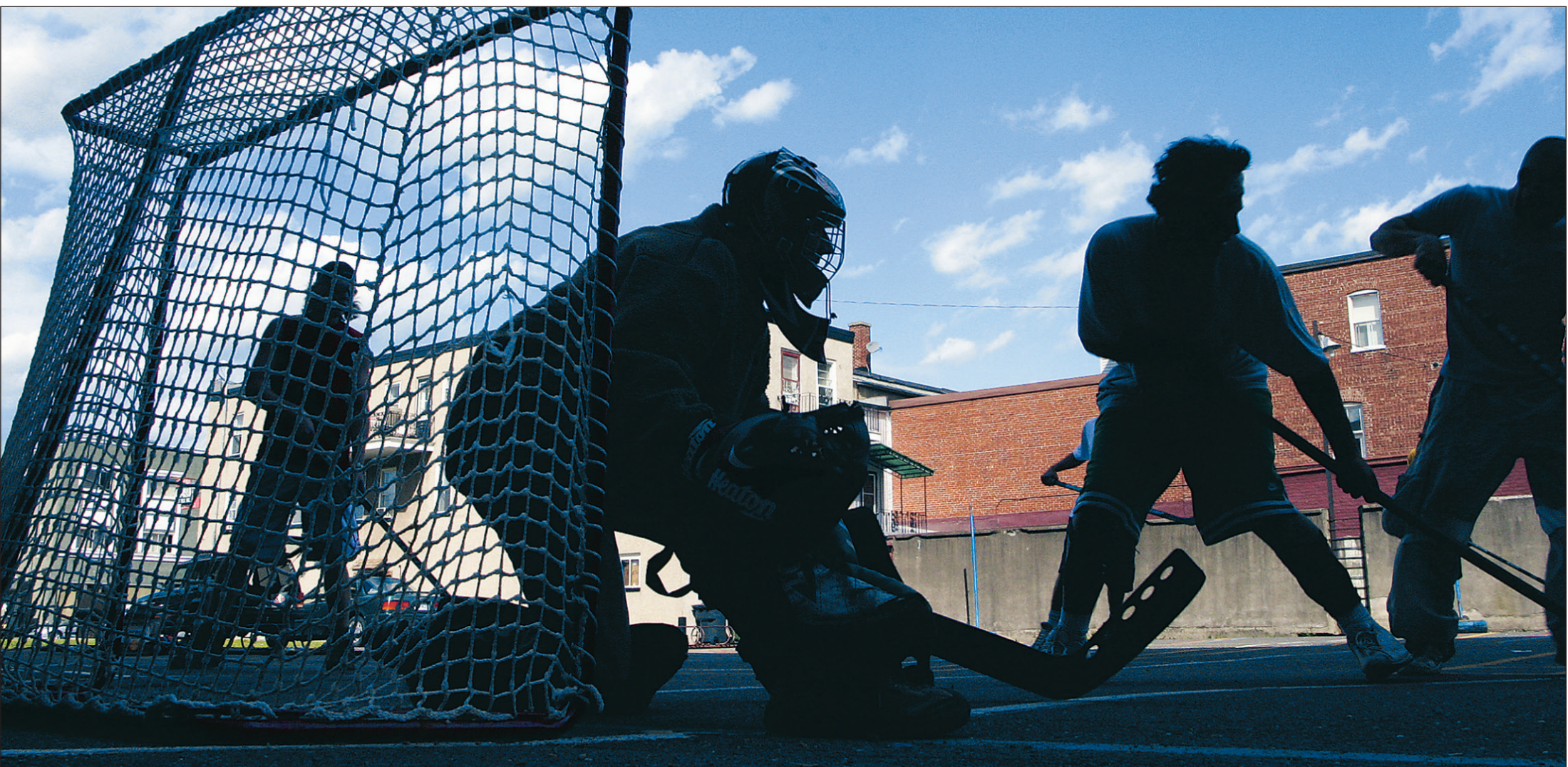
L'été? Pas une raison pour ranger son hockey. Partie entre copains dans la cour d'une école au centre-ville de Granby.