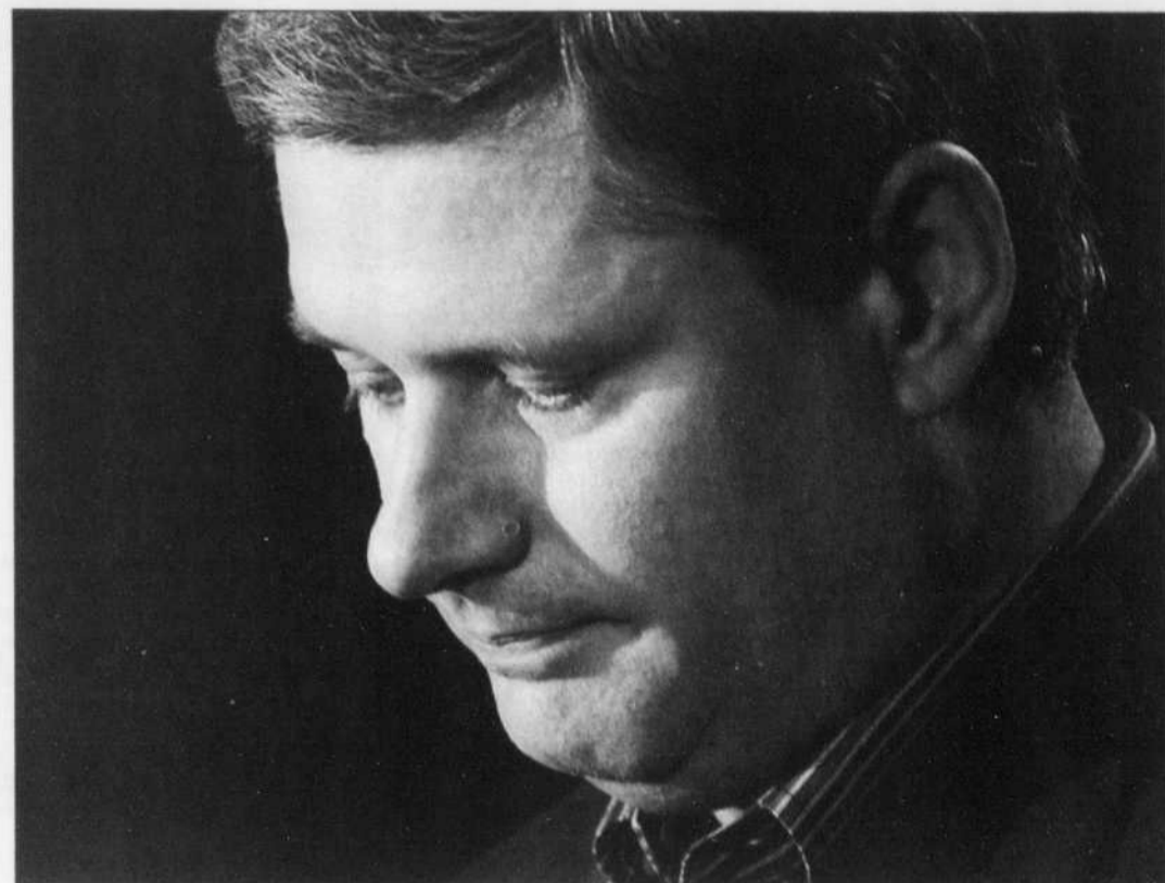
Le premier ministre Stephen Harper et les conservateurs ne veulent pas toucher de près ou de loin à la question de l'avortement de peur d'effrayer l'électorat.

La délicate question de l'avortement suit les conservateurs, comme les alliés et les réformistes avant eux. Lors de la dernière campagne électorale, le chef li-