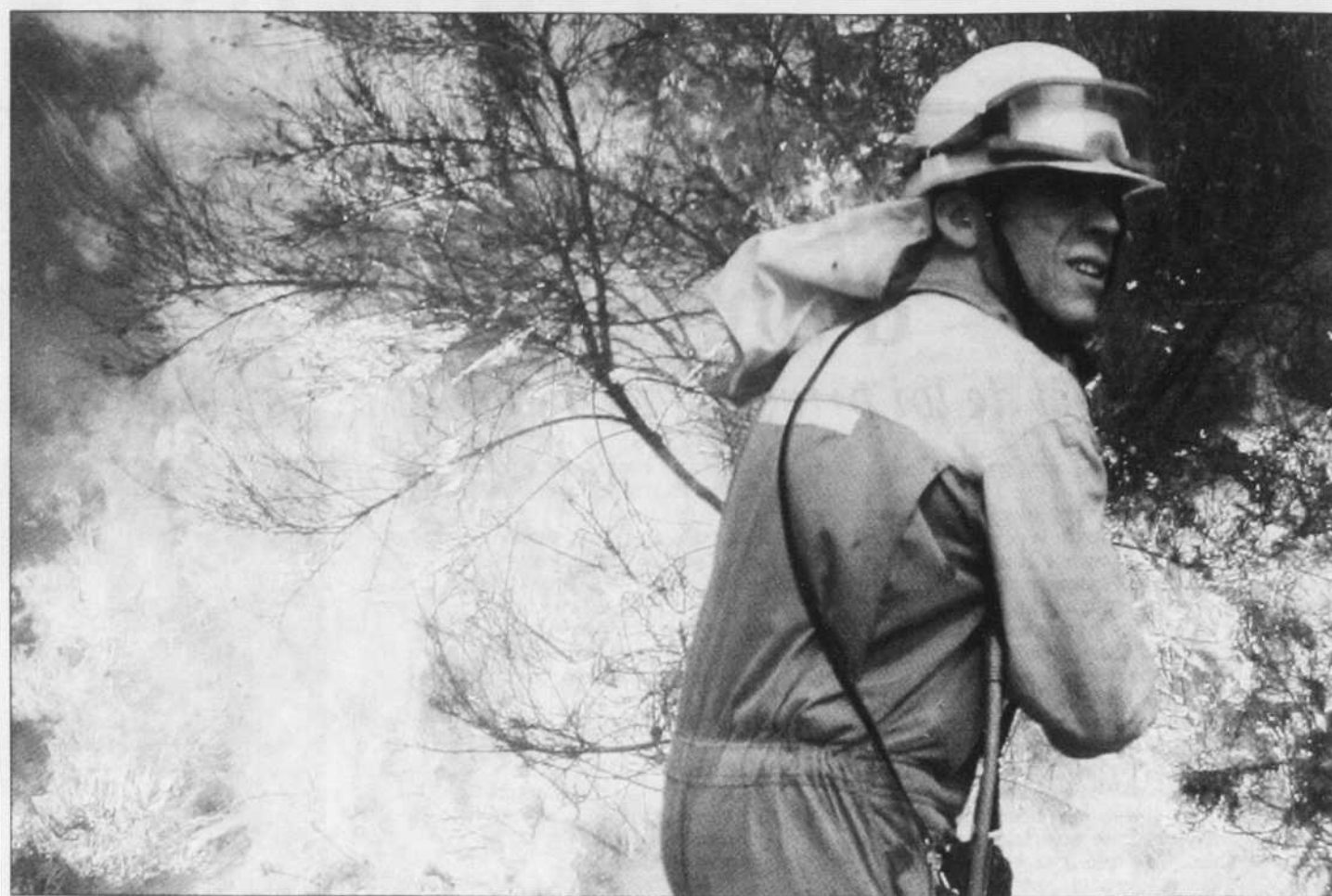
Un pompier combat les incendies qui ravagent la forêt en Galice, dans le nord de l'Espagne.