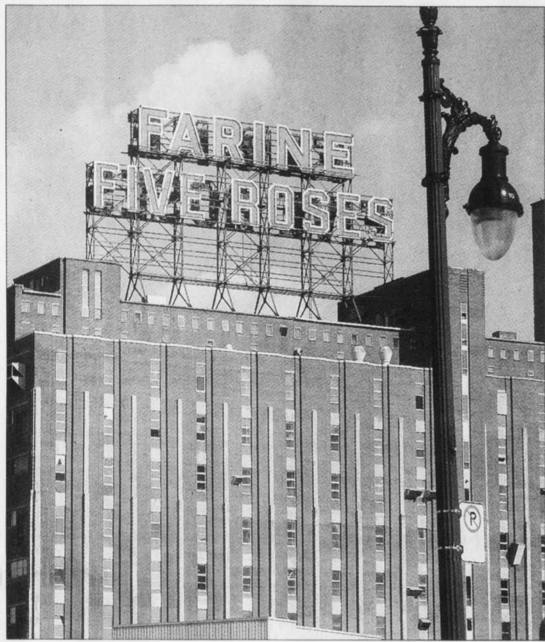
Au moins un sursis pour le néon géant Farine Five Roses, au centre-ville de Montréal.

Montréal a connu un mois de juillet particulièrement chaud, le troisième le plus chaud depuis 65 ans selon des données compilées et dévoilées hier par le Centre de ressources en impacts et adaptation au climat et à ses changements (CRIACC). Globalement, au Québec, bien qu'il n'y ait pas eu une quantité «extraordinaire» de journées où le mercure a dépassé 30 °C, on a noté des températures moyennes de 1 à 2 degrés plus chaudes que la normale mensuelle. À Montréal, c'est la troisième fois, après en 1975 et 1995, qu'on ne recense au mois de juillet aucune journée où la température a été inférieure à 18 °C degrés. À Sherbrooke, ce fut le mois de juillet le plus chaud depuis 45 ans, tandis que Québec enregistre la cinquième «performance» de son histoire récente. Mais ce sont surtout la quantité et la force des orages qui ont marqué les observateurs du CRIACC: les orages ont été plus fréquents qu'à l'habitude, et certains d'entre eux «sont très violents en plus d'engendrer de nombreux dommages et inconforts». — Le Devoir