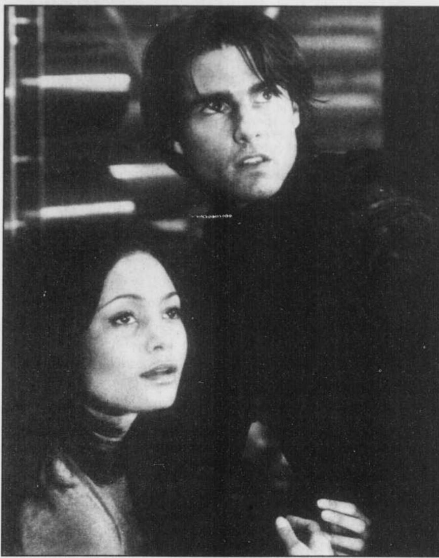
Une des scènes les plus poignantes de MI2 , mettant en vedette Tom Cruise dans le rôle de l'agent Ethan Hunt, et Thandie Newton, qui incarne la belle Nyah Hall.

Deuxième réussite: la photographie. La majeure partie de l'histoire de MI2 se passe en Australie, qui n'est pas en manque de paysages époustouffants. Mais ce sont surtout les falaises de Moab, en Utah, qui laissent bouche bée, surtout quand on y voit Hunt les gravir à mains nues. De quoi donner le