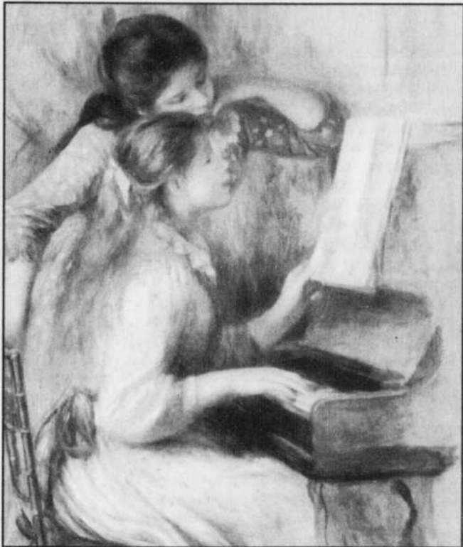
Jeunes filles au piano, Pierre-Auguste Renoir, vers 1892.

«C'est très rare d'avoir une seule et même collection avec autant d'oeuvres impressionnistes. Il est remarquable qu'une seule personne ait possédé tous ces tableaux», note Jean-Pierre Labiau, du Musée des Beaux-Arts de Montréal.