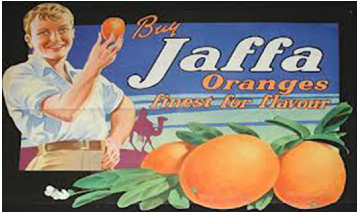
Image tirée du documentaire d'Eyal Sivan: Jaffa, La mécanique de l'orange : https://www.youtube.com/watch?v=gxTAXlPxeGM