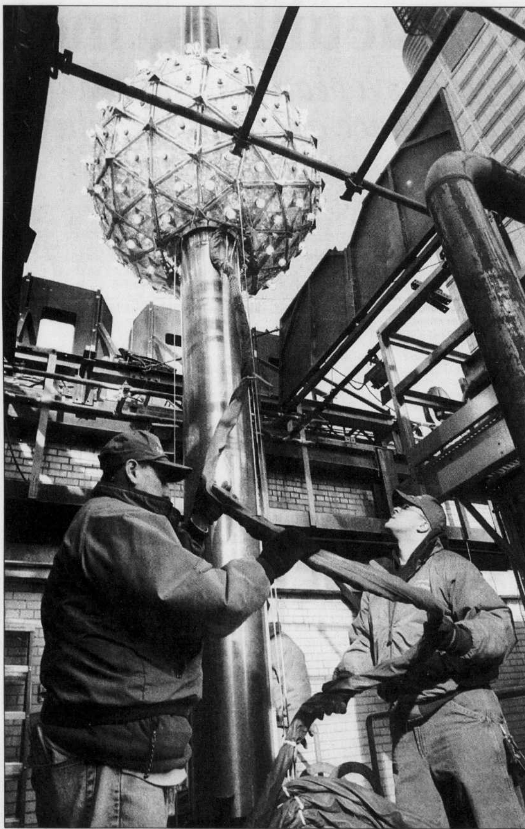
Des employés s'affairaient hier à installer la traditionnelle boule de cristal que l'on fait descendre à Times Square pour marquer le passage à la nouvelle année.

(Le Devoir) — La grève, prévue pour le 31 décembre, est évitée au Casino de Montréal. Lors d'un conseil hier après-midi, le Syndicat a décidé de recommander l'adoption de la dernière offre de l'employeur. Les 850 croupiers du Casino de Montréal se prononcèrent donc en assemblée générale, à la mi-janvier, sur la proposition de convention collective. Les membres du syndicat des croupiers du Casino de Montréal (SCFP-FTQ) s'étaient prononcés, le 24 septembre dernier, en faveur d'une grève générale pouvant être déclenchée dès aujourd'hui, dans une proportion de 97 %. Les principaux points en litige concernaient les horaires de travail, la formation et le mécanisme de répartition des pourboires, alors que le casino prélève 6,50 $ l'heure sur les pourboires. Les détails de l'entente seront connus après l'assemblée générale.