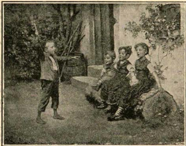
LA LEÇON DE SOLFÈGE.

Dans la Fuite en Égypte , on nous montre Jésus en butte, dès sa naissance, aux persécutions des méchants, persécutions qui ne finiront probablement qu'avec le monde. — Une autre leçon, c'est le dévouement à toute épreuve de Joseph et de Marie pour le divin dépôt confié à leur garde : dévouement qui se manifeste si bien dans cette circonstance tragique.