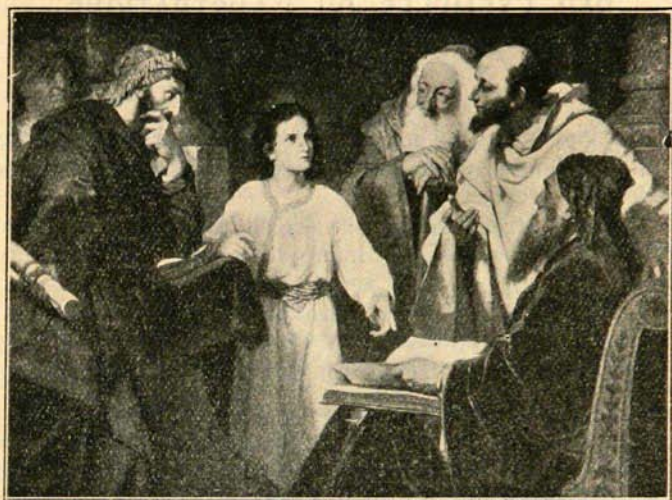
JÉSUS AU MILIEU DES DOCTEURS.

de sagesse alliée à une si grande modestie, dans un enfant de douze ans!