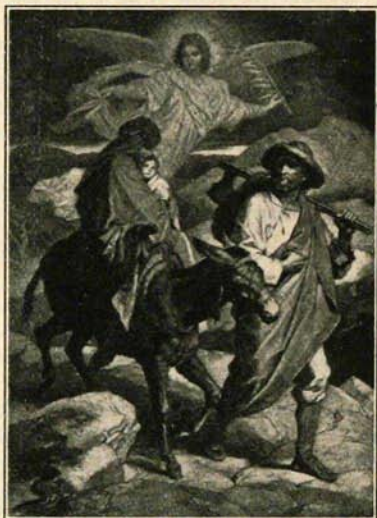
QUAND LA HAINE CONSPIRE (POUR PERDRE), L'AMOUR VEILLE (POUR SAUVER).

Le peintre, comme l'écrivain, recourt très souvent à ce procédé du développement d'une idée par les effets , surtout pour représenter une chose abstraite : comment, par exemple, peindre une vertu, un sentiment, etc., sinon en mettant sous les yeux, les gestes ou les actes qu'ils inspirent? Les personnages y étant forcément muets, leurs sentiments doivent être manifestés par l'expression de la figure, surtout des yeux, le mouvement de la main, l'attitude, etc. Cette remarque est très importante : elle pourra aider à mieux comprendre et apprécier une gravure ou un tableau.