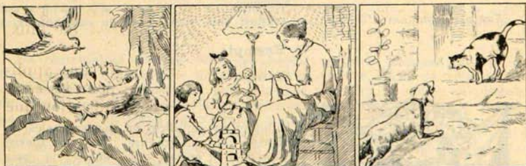
CADEAUX DE NOËL.

Sous les caresses maternelles, Nous grandissons dans un doux nid.