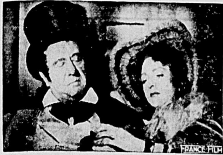
Les nouveaux films arrivés de France prennent l'affiche samedi au St-Denis. La saison 46 sera inaugurée avec "Le Colonel Chabert", de Balzac, mettant en vedette le célèbre artiste RAIMU dans le rôle-titre et MARIE BELL, de la Comédie-Française que l'on voit ici dans une scène de cette somptueuse production.