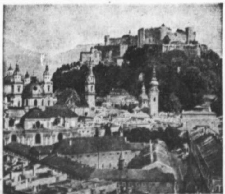
Domine par l'imposante silhouette du château-citadelle où le prince-archevêque de Salzbourg reçut souvent Mozart, la célèbre petite ville autrichienne grouille, en cette saison de l'année, de milliers de mélomanes accourus du monde entier pour assister au festival annuel de musique. Les téléspectateurs du réseau français de Radio-Canada se consolent de ne pas se trouver à Salzbourg même, les dimanches 4 et 11 juin, de 2 h. 30 à 4 heures de l'après-midi, en assistant à une représentation, en deux tranches, de Don Juan de Mozart. Filmée dans la ville même du célèbre compositeur, l'oeuvre est dirigée par le regretté chef d'orchestre WILHELM FURTWÄNGLER et met en vedette, dans le rôle-titre, le magnifique baryton CESARE SIEPI. RADIO-CANADA—L'ÉLAN D'UN QUART DE SIÈCLE