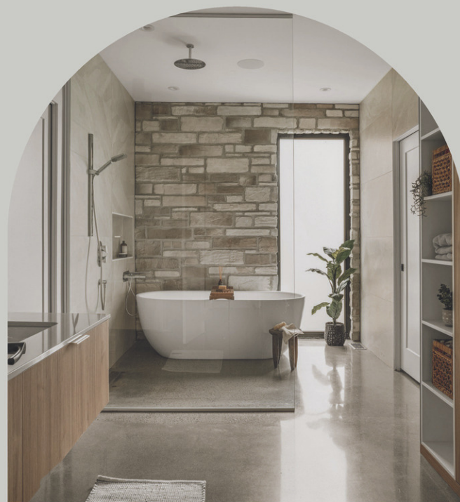
Firme: Atelier Niché