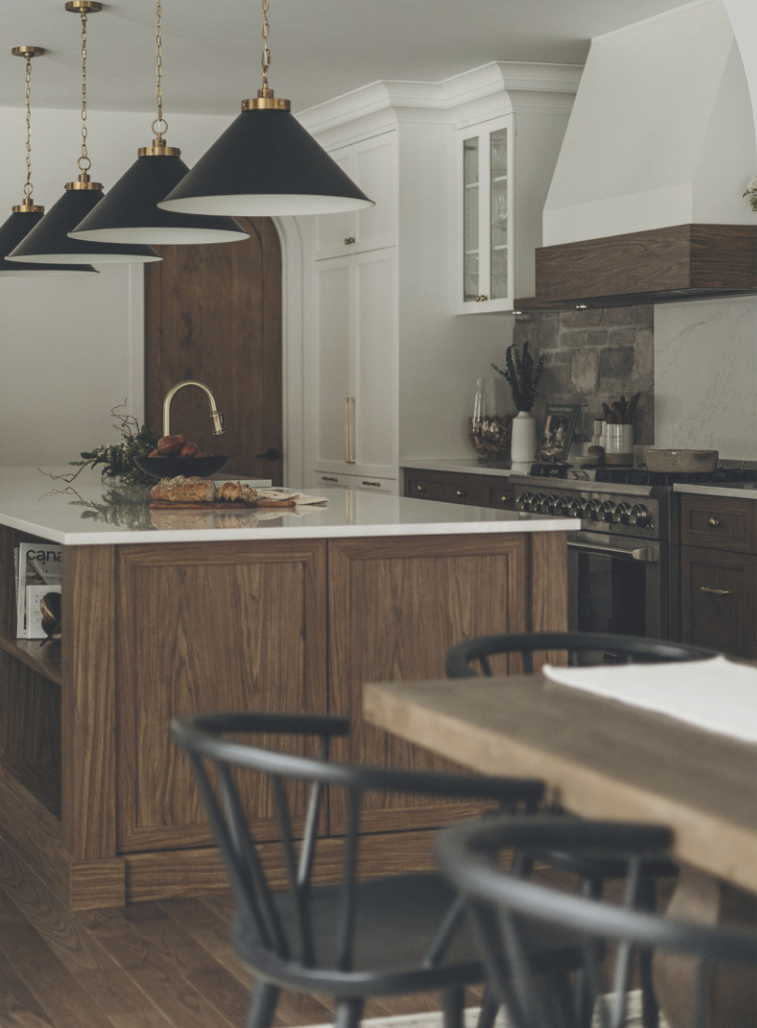
Firme : DRYBURGH design architecture

Chaque projet raconte sa propre histoire et mérite d'être mis en valeur. Avoir des photos par une photographe spécialisée dans ce domaine permet de bien présenter votre projet à vos clients et d'avoir un portfolio professionnel et crédible.