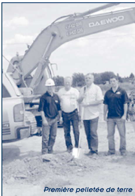
Première pelletée de terre

Le CPI vient d'agrandir son parc industriel en faisant l'acquisition d'un nouveau terrain situé au coin de la 1 ère Avenue et de la rue Fortin. Le but de cette acquisition est la construction d'une nouvelle bâtisse qui sera le Complexe industriel # 7. La réalisation de ce nouvel édifice de 6000 pi 2 est attendue par une entreprise qui veut s'implanter chez nous. Preuve qu'il faut toujours être prêt à répondre aux besoins.