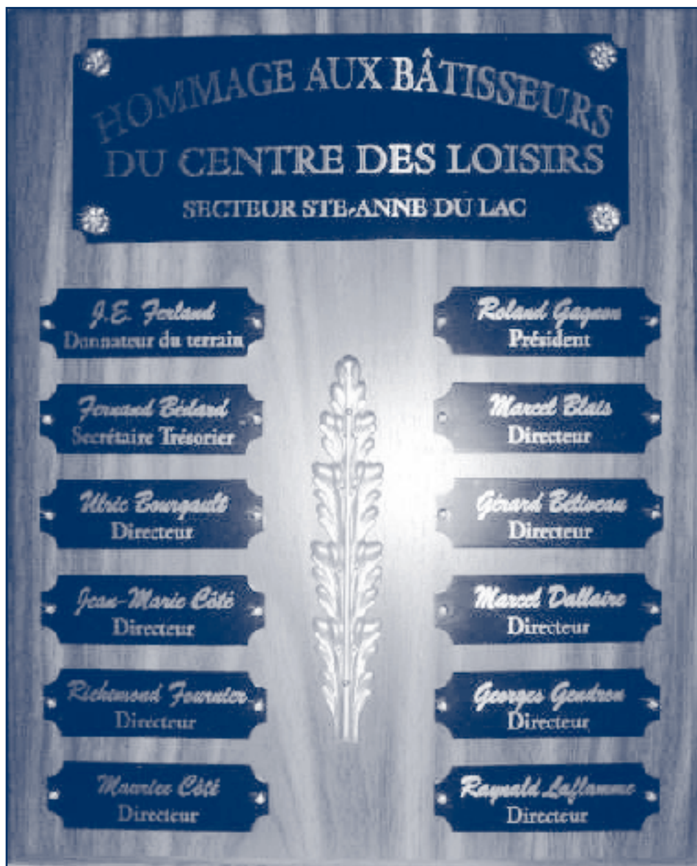
Plaque souvenir des bâtisseurs du Centre des loisirs de Sainte-Anne du Lac, initiative de la municipalité d'Adstock en 2012.

La plaque commémorative sera installée en permanence dans le « Centre des loisirs de Sainte-Anne du Lac » à la vue de tous les usagers.